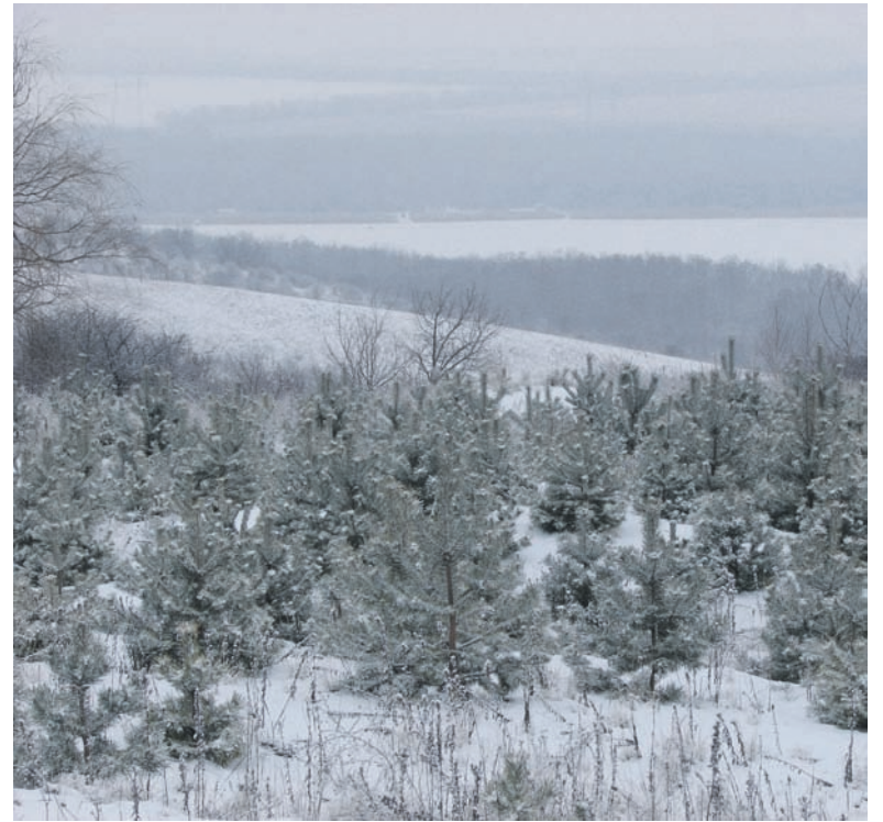
Сосновий лісок регіонального ландшафтного парку «Клебан-Бик»

На жаль, більшості людей ліс досі здається невичерпним ресурсом. Саме через це упередження продовжують знищуватися ялинки в лісах і, що ще трагічніше, трапляються браконьєрські рубки в межах міста або на особливо охоронюваних природних територіях. Хвойні ліси дуже вразливі. А між тим для