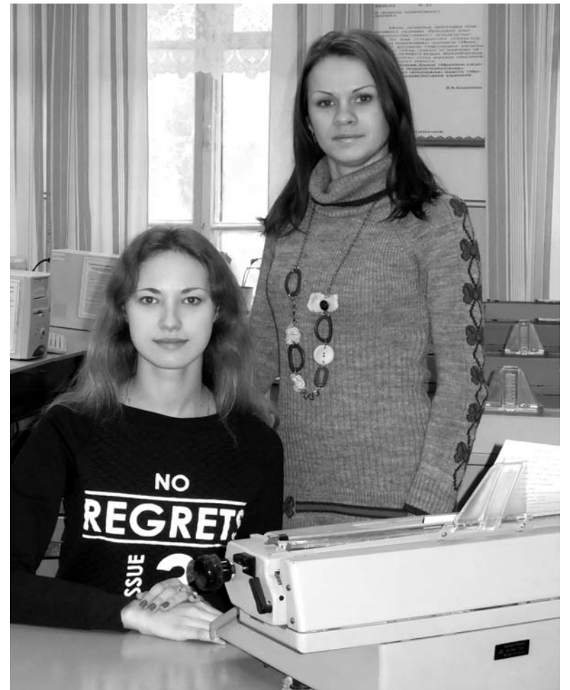
Ответственности, внимательности, коммуникабельности учат школьников в Константиновском МУПК по специальности «Секретарь руководителя»