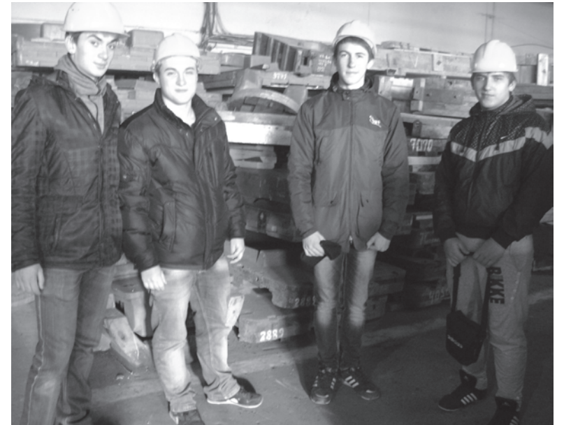
С начала года более 120 студентов прошли преддипломную и производственную практику на предприятии «Корум Дружковский машиностроительный завод»

сом. – Мы сотрудничаем с такими учебными заведениями, как: Донбасская государственная машиностроительная академия, Краматорский машиностроительный колледж, Краматорский технологический техникум, Дружковский профессиональный лицей. Кроме того, наших специалистов в качестве экс-