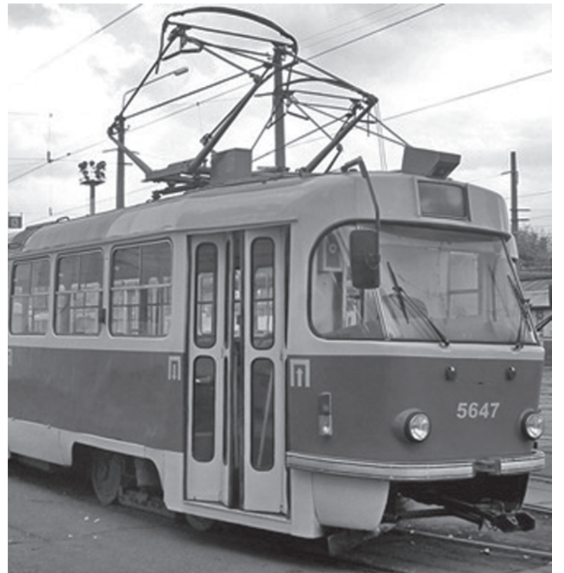
Подобные вагоны уже возят пассажиров по маршруту № 1

К слову, чешские трамваи уже смогли положительно зарекомендовать себя в Дружковке. С начала года три таких вагона довольно успешно обслуживают городской маршрут № 1.