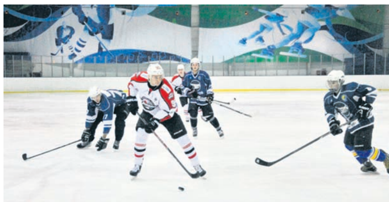
Атакующий порыв ХК «Донбасс» в матчах с «Юностью» было не остановить

В первом поединке на арене «Салтовский лед» гости забросили в ворота «Юности» 21 безответную шайбу, а во втором – 19, пропустив всего одну.