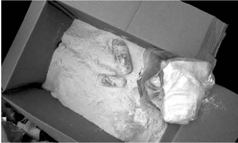
В посылке мукой были присыпаны пакеты с кристаллическим веществом, содержащим тяжелый психотропный наркотик метадон

Вскоре за посылкой пришел адресат – 59-летняя пенсионер-