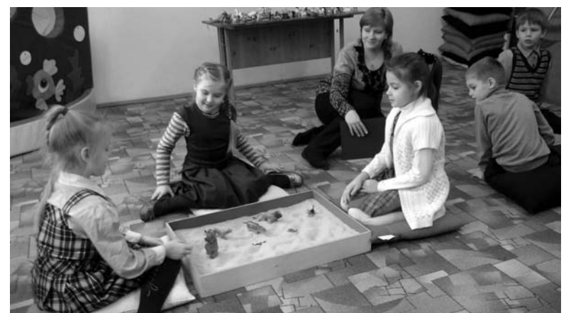
На занятиях дети с удовольствием играют песком