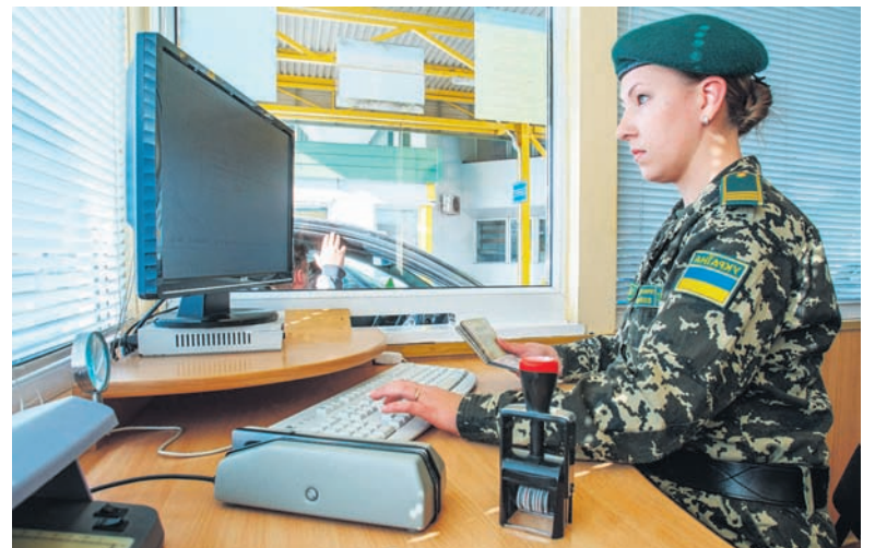
Стоит обратить внимание при прохождении погранконтроля на КПВВ: если Вас отправляют для уточнения своих данных к представителю координационной группы, то это для Вас звоночек – вы не попали в единую систему пограничной службы

– Действительно, такие случаи есть. Первоначально пропуска оформляли только по секторам, то есть каждая группа работала автономно. Данные об оформленных пропусках передавались ежедневно для внесения в единую систему пограничной службы, при этом мог произойти какой-то сбой и чьи-то данные не попали. При оформлении бумажных пропусков мог присутствовать и человеческий фактор: допустил ошибку оператор при наборе данных лица в реестре, заявитель в своих данных, она отразилась на бумажном пропуске. На контрольном пункте отдал, все сошлось, проходите. А при чтении данных машиной даже одна буква или цифра выдает результат: таких в базе