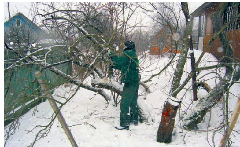
Лучше заранее спланировать масштабы обрезки

Наверняка, понадобится стремянка, лучше заранее ее достать, или купить. И садовый вар или масляная краска. Необходимые покупки хорошо бы расплани-