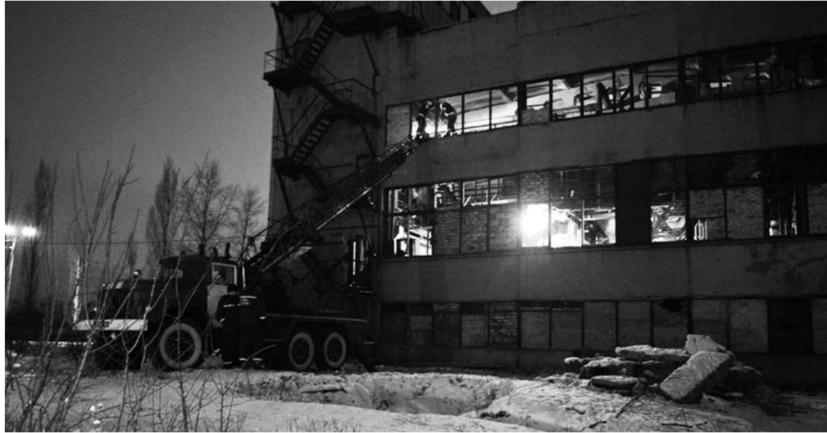
Взрывом были повреждены около 80% стекол котельной, что негативно сказалось на состоянии отопительной системы