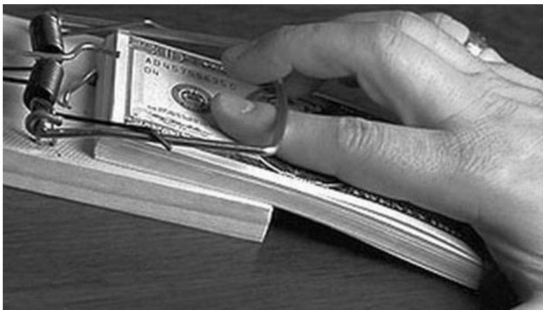
Взяточника задержали «на горячем»

В минувшую среду, 20 января, в Краматорске во время получения неправомерной выгоды задержано должностное лицо Государственной миграционной службы Украины. Об этом сообщает пресс-служба Краматорской местной прокуратуры.