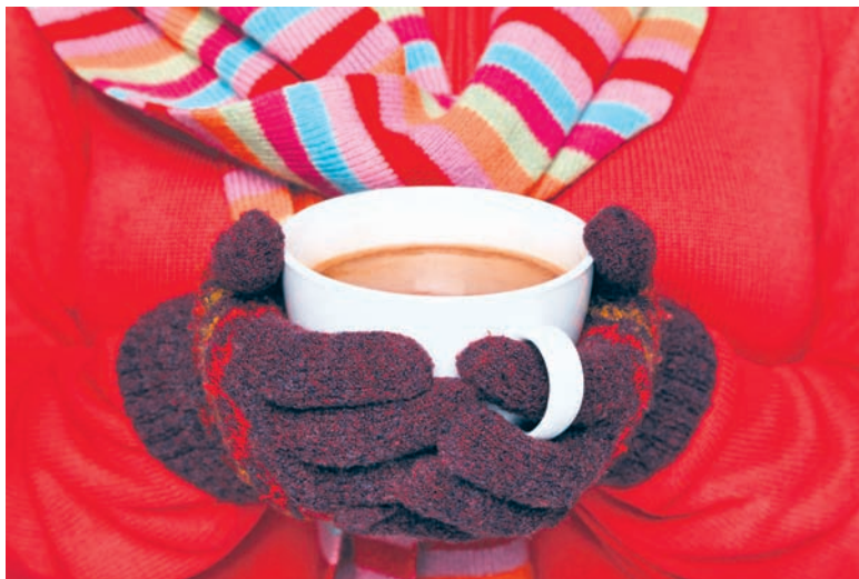
Балуите себя «тепловой бомбой»