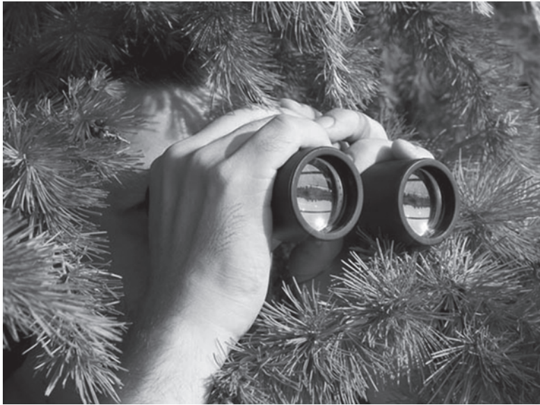
Беспилотники хорошо просматриваются в бинокль