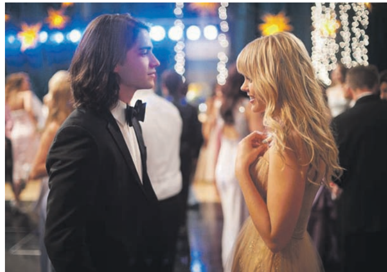
Выпускной вечер – одно из самых запоминающихся событий

С девочками посложнее. Для них внешний вид в этот день имеет особое значение: платье, прическа, туфли – обо всем этом необходимо позаботиться заранее. Выпускной – это праздник юности, свежести, а потому девушкам не стоит надевать вечерние платья, предназначенные для взрослых женщин, и, уж тем более, наряды с обруча-