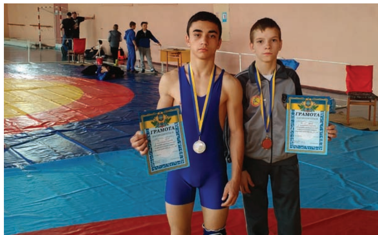
Юные призеры чемпионата Украины

Порадовал своим выступлением на чемпионате и представитель спортклуба «Бросок» села Торское, Константиновского района, и районной ДЮСШ «Ко-