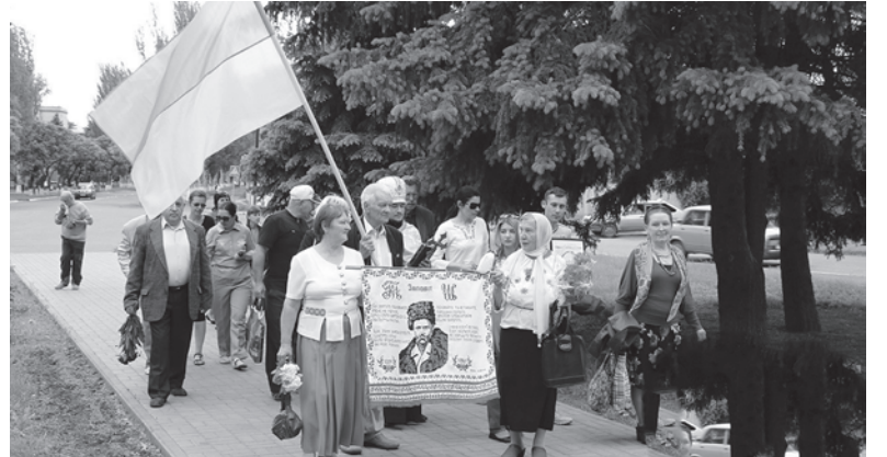
Торжественный марш активистов-общественников в Славянске