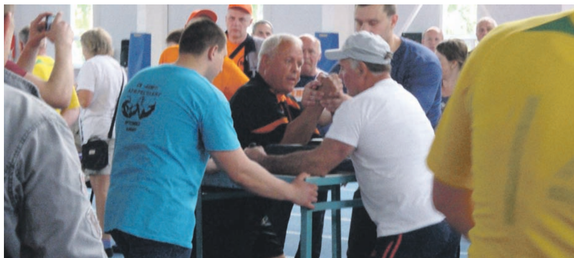
Соревнования по армреслингу

Мужчины и женщины из всех уголков области соревновались в