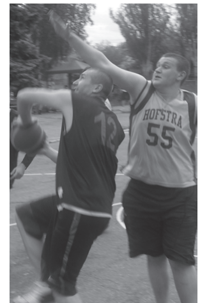
За победу сражались семь команд

– «Артемсоль», Соледар; 2 место – «Березка», Константиновка; 1 место – «Бахмутские», Бахмут.