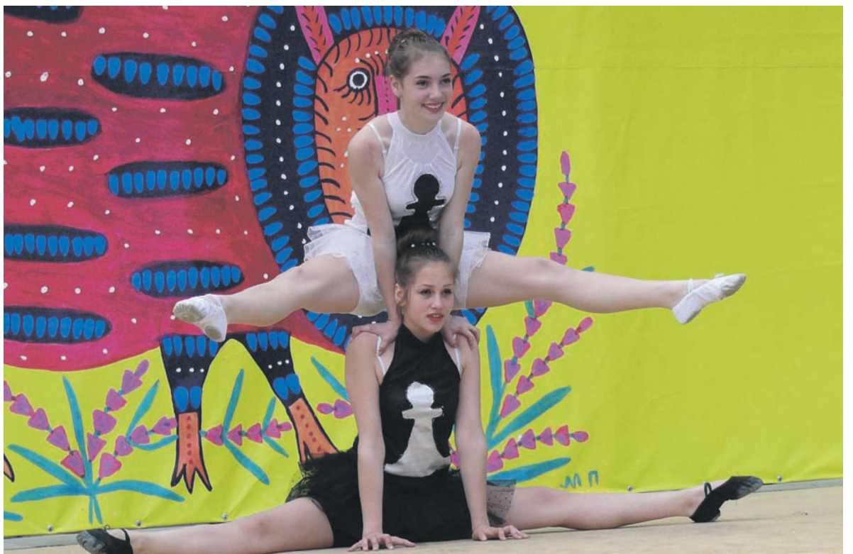
Зрители радовались выступлениям цирковых коллективов

городом. И очень символично, что малыши не без помощи родителей, бабушек и дедушек во время еще одного мастер-класса высадили аллею многолетних цветов и трав. Они вместе будут подрастать, приумножая добрые традиции во имя будущего нашего региона.