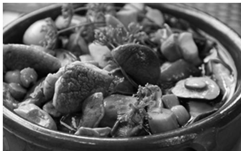
Блюда из грибов полезны и диетичны

С того времени как мы стали публиковать рецепты блюд от повара Юлии Балашовой, к нам стали присылать свои рецепты читатели. В этот раз мы выбрали блюда из грибов. Дело в том, что в этом году они уже весной уродили на славу. Грибы – ценный пищевой продукт. Они по праву считаются белковым продуктом, в котором полезных веществ даже больше, чем в мясе или яйцах. Мало того, грибы являются незаменимым ингредиентом большинства диетических блюд, так как их калорийность ничтожно мала.