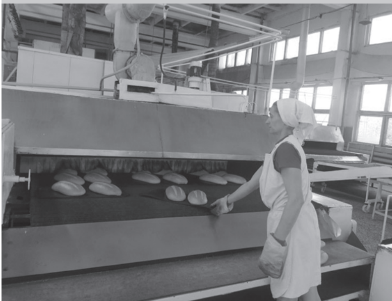
Объем производства – 22 т хлебобулочных изделий в сутки

Полную версию репортажа читайте на сайте газеты ZI.DN.UA