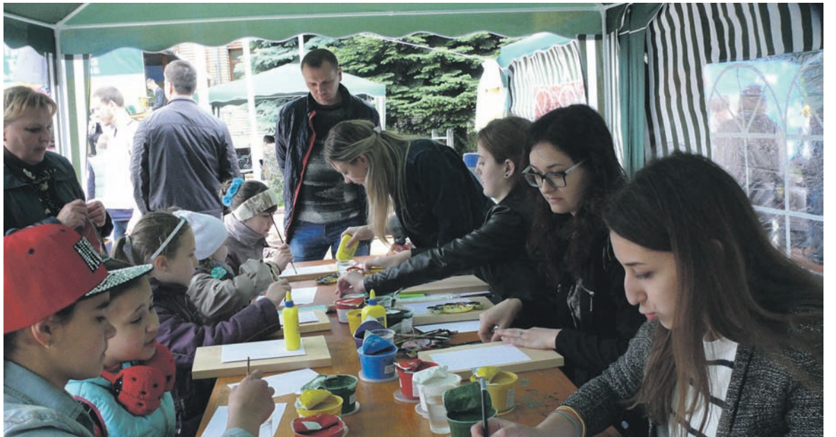
Девушки из Харьковской академии дизайна и искусств учили всех желающих основам Петриковской росписи