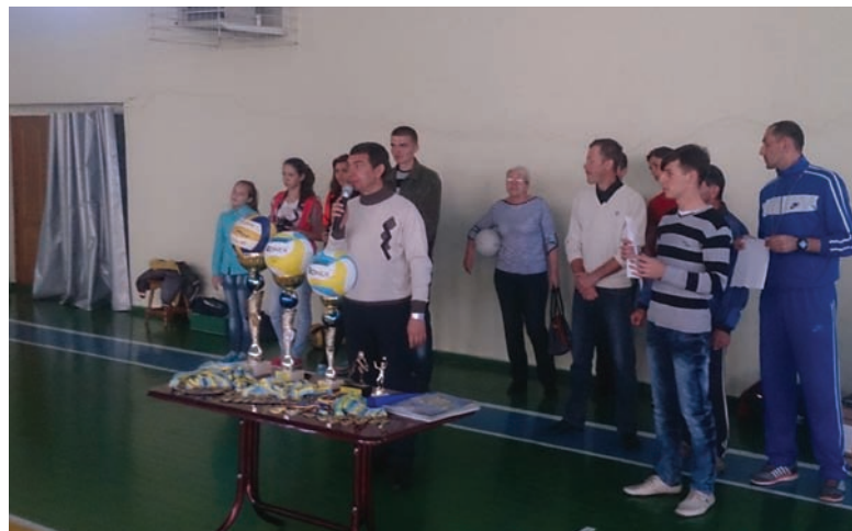
Организаторы наградили победителей кубками, дипломами, медалями, спортивным инвентарем, грамотами

Команды-призеры награждены кубками, дипломами, меда-