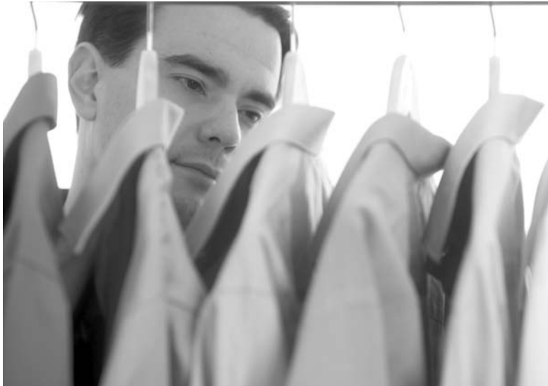
Преступник делал вид, что выбирает себе костюмы и рубашки

В Краматорском городском суде рассматривалось дело о нашедшем ограблении. Напомним обстоятельства происшедшего. Двадцатипятилетний житель Слявянска, цыган, вместе с восьмилетней дочерью ходил по краматорским бутикам, выбирая себе дорогие костюмы и рубашки. Приценивался, мерял, просил отложить некоторые вещи. Но расплачиваться не спешил. На самом деле это был всего лишь хитрый маневр. Злоумышленник пытался выяснить: установлены ли в магазине камеры видеонаблюдения. В одном из бутиков и камер не оказалось, и вещи были очень даже приличные. Мужчина подобрал ко-