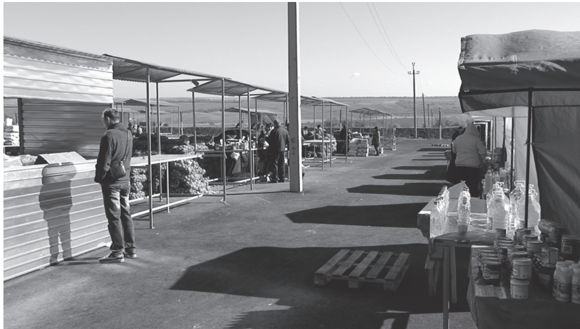
Сейчас постоянного оживления на территории логоцентра, в Зайцево, не наблюдается