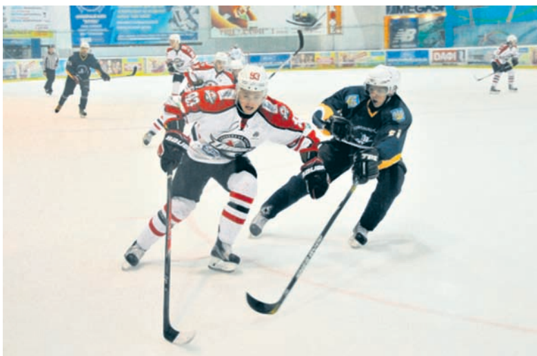
Скорости хоккеистов «Донбасса» и «Витязя» в двух поединках, проходивших в Харькове были самые высокие

В статье использованы материалы пресс-службы ХК «Донбасс»