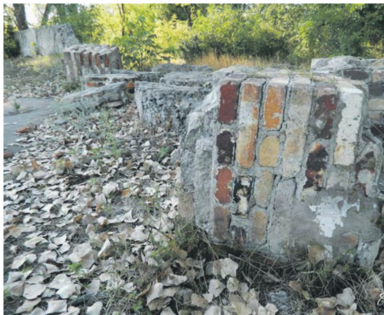
То, что осталось от «дома Гомона»

Похоже, что в нынешнее время плачевная участь может постигнуть многие памятники истории. Недавно Министр культуры Украины Вячеслав Кириленко предложил правительству «Концепцию реформы в сфере сохранения культурного наследия». Если охарактеризовать кратко, то все сводится к фактическому уменьшению государственного контроля по охране памятников. Историки считают: эти шаги могут создать реальный риск полного уничтожения этих объектов, а никак не улучшение состояния их сохранности.