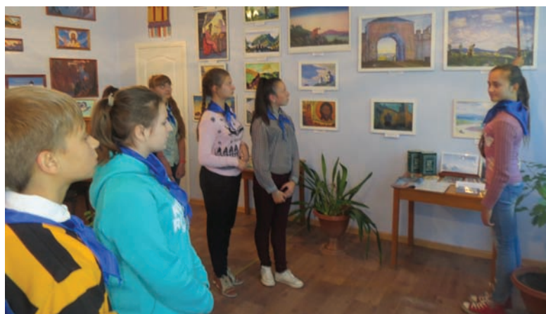
В школьном музее