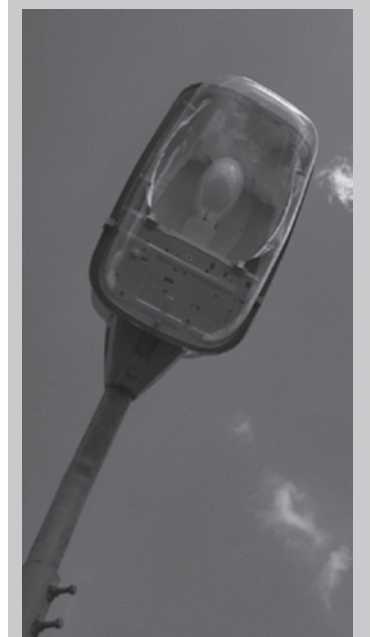
Наталья ЖМУЦКАЯ, журналист

Учитывая такие непредвиденные расходы, предприятию необходимо иметь в резерве достаточное количество ламп, стоимость которых к тому же растет день ото дня. На эти нужды на 60-й сессии второго созыва организации было выделено 50 тыс. грн. из городского бюджета.