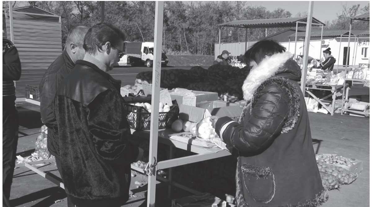
На импровизированную осеннюю ярмарку овощей и фруктов некоторые впервые приехали из Донецка

Неудобство доставляют закрытый на момент визита наших журналистов один из двух банкоматов отделения «Ощадбанка». Но работники финансового учреждения это явление характеризуют как временное. Зато на днях появилась на территории логистического центра новая услуга – мобильное отделение «Укрпочты», – где можно осуществить платежи, отправить телеграмму или письмо, приобрести