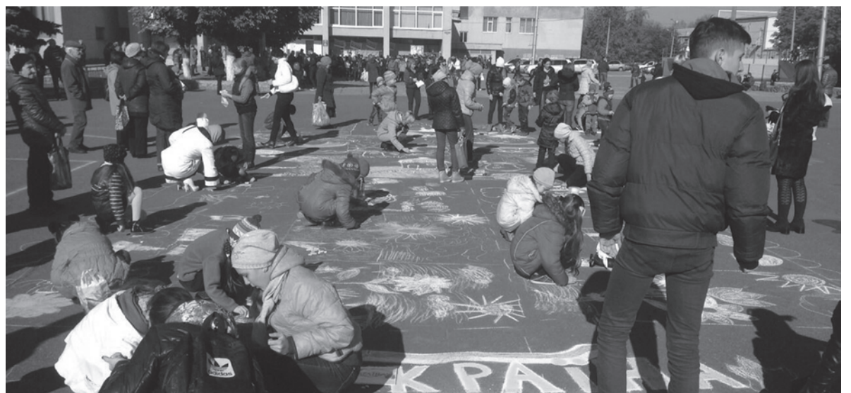
Праздничным концертом, флэшмобом, велопробегом и конкурсом рисунков отметили дружковчане День украинского казачества.

Праздник получился по-настоящему живым и веселым. Так что дружковчане не словом, а делом доказали, что не зря суще-