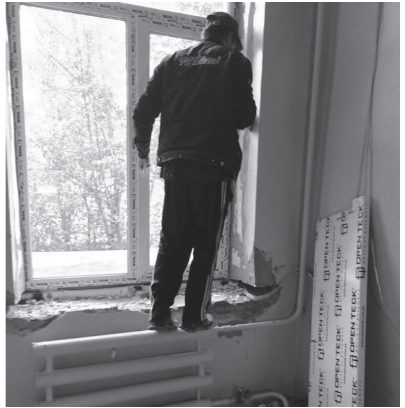
В отделениях устанавливают 86 новых пластиковых окон