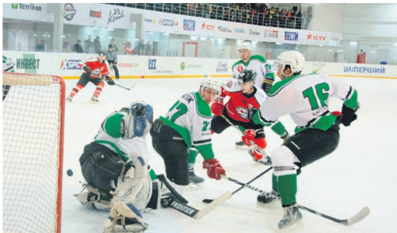
«Рапид» ничего не смог противопоставить мастерским и результативным атакам ХК «Донбасс»

Как киевляне ни упирались, раз за разом нарушая правила, они пропустили в общей сложности 11 шайб, причем шесть из них – в меньшинстве. Интересно, что в составе «Донбасса» дублем смог отличиться толь-