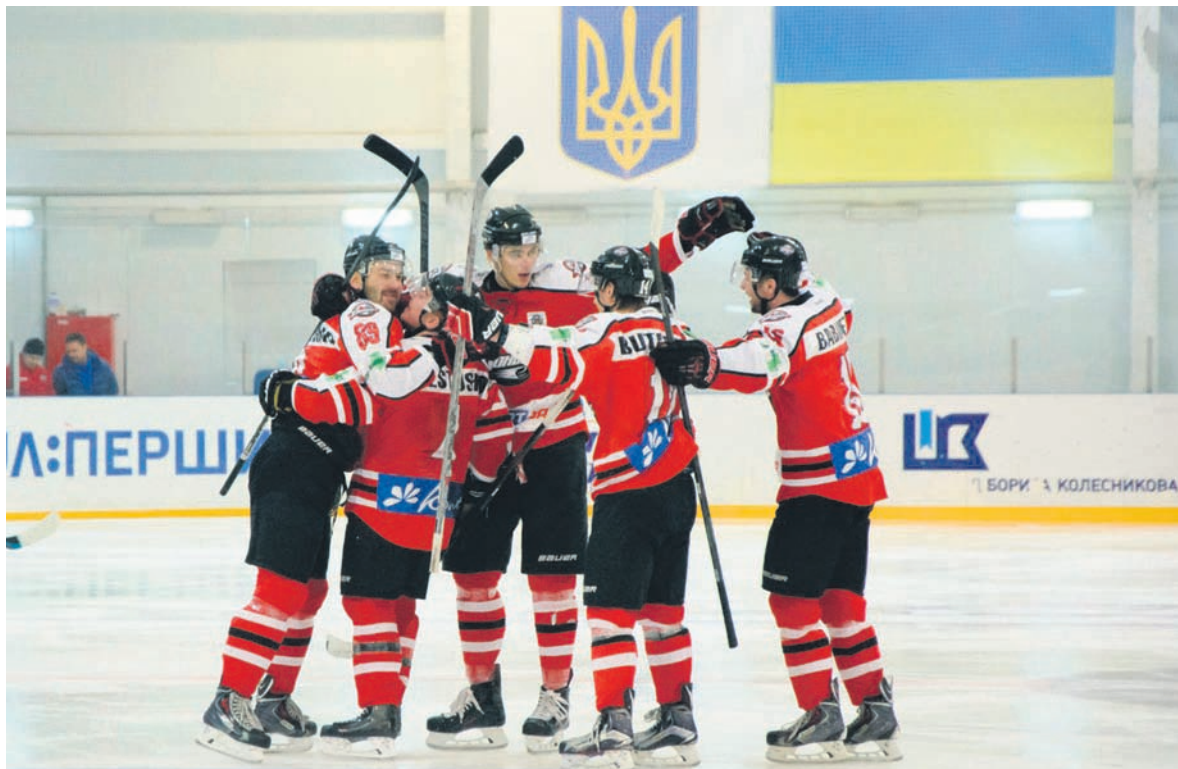
Игроки ХК «Донбасс» за два круга чемпионата Украины забросили в ворота соперников 296 шайб