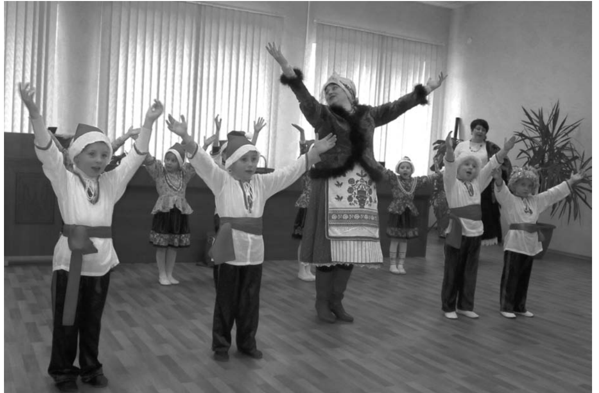
Воспитанники детского сада «Дюймовочка» порадовали налоговиков танцами в собственном исполнении