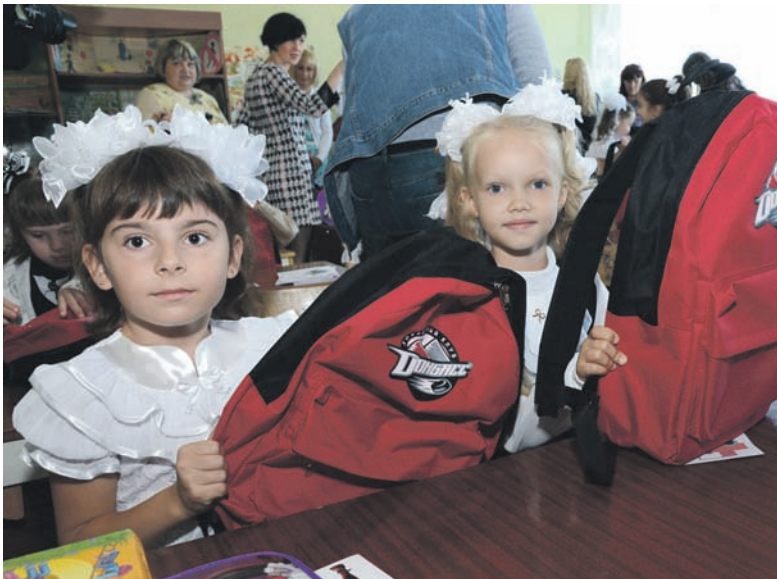
Среди вспышек фотоаппаратов и объективов телекамер, в окружении известных на всю Европу спортсменов сотни мальчиков и девочек посетили свой первый в жизни урок

и школьники не скрывали эмоций, они были искренне рады оказанному вниманию. На торжественной линейке ко Дню знаний гостей ждали и в Константиновской специализированной школе № 6. Как рассказал журна-