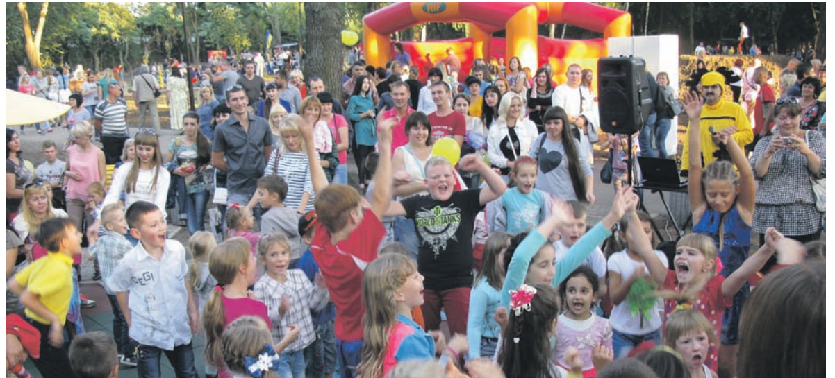
Посетителей парка смело можно было измерять десятками тысяч