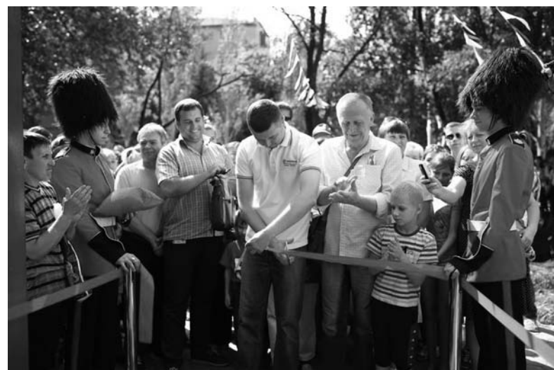
Торжественное открытие магазина Vodafone в Краматорске

А очередь к чудо-будке не иссякала до закрытия салона – связь, обеспеченная Vodafone, соединяла людей, находящихся за тысячи километров друг от друга. И, положив трубку, они не могли скрыть улыбку от общения с родственниками и друзьями, проживающими или работающими в далеких странах. А разве не для этого и существует мобильная связь?