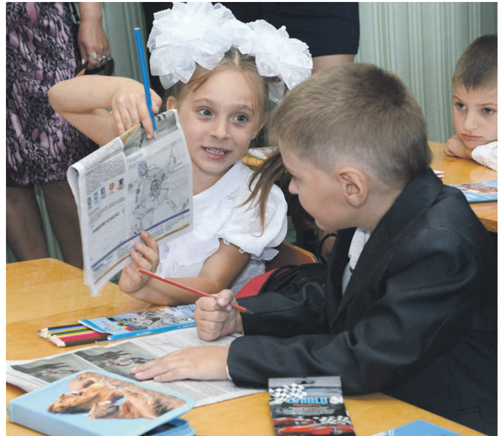
Детвора с интересом и воодушевлением изучала подарки