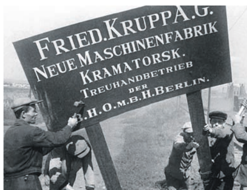
1943 год. Рабочие Краматорского машиностроительного завода срывают с заводского здания вывески германского капиталиста

14 августа 1943 освободили Славянский район. С 3 по 5 сентября велись бои за населенные пункты Артемовского и Дзержинского районов. 6-7 сентября армия освобождала Константиновку, Красноармейск, земли, примыкающие к Краматорску,