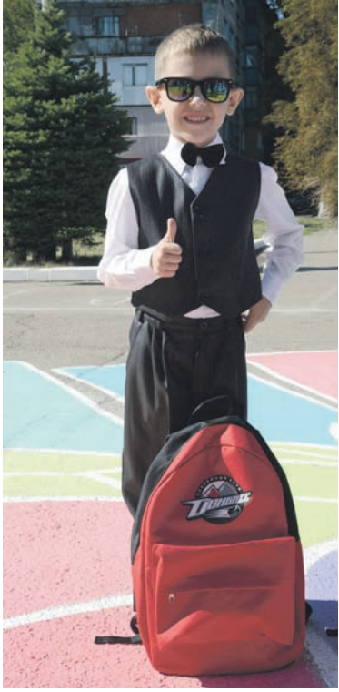
Стильный рюкзак – стильному парню