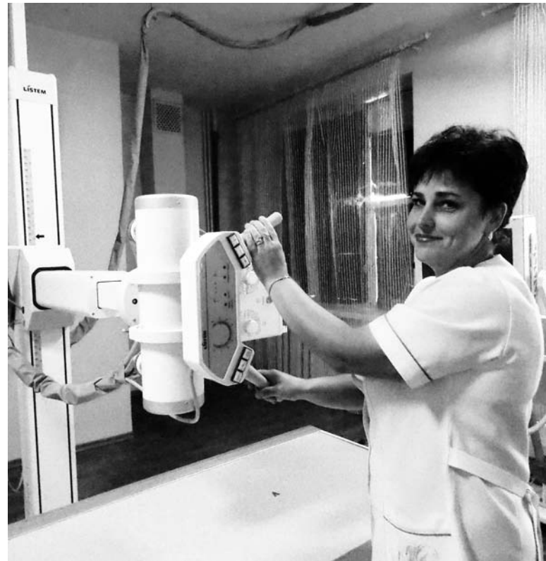
Ежедневно на цифровом рентгенологическом оборудовании обследуется до 150 человек

Очень важным направлением в работе специалистов является детская хирургия. Ведь ребенку нужен особый подход. И делать это может лишь профессионал. В лечебном учреждении существуют и другие области хирур-