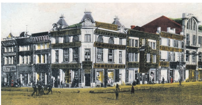
Так выглядел центр города в 1913 году