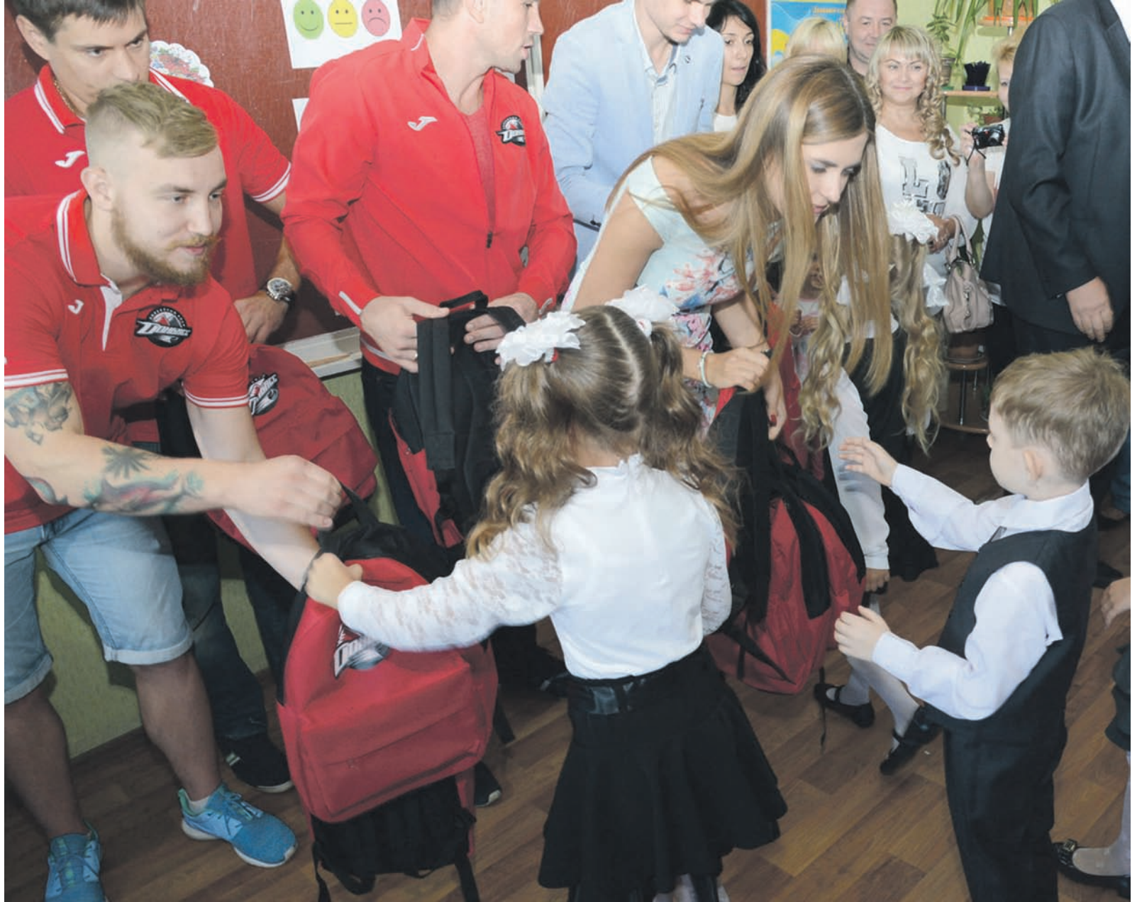
Делегации, в составе которых были представители Фонда и хоккеисты ХК «Донбасс», лично посетили учебные заведения Дружковки, Константиновки, Славянска, Святогорска, Краматорска, Николаевки, Константиновского и Красноармейского районов

– Мы привезли детям подарки – портфели, в них есть все