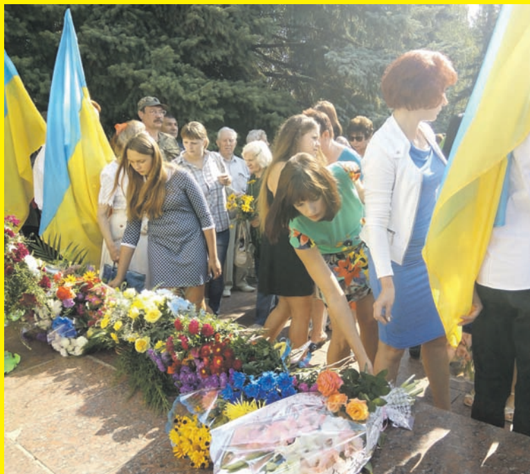
Не забывать и не терять чувства благодарности – то малое, что сегодня может сделать каждый

Защитить Константиновский район от захватчиков пошли на фронт 5,5 тысяч человек. Половина из них погибла. Сейчас на админтерритории еще живы 12 участников боевых действий, однако практически все прикованы к постели по состоянию здоровья.