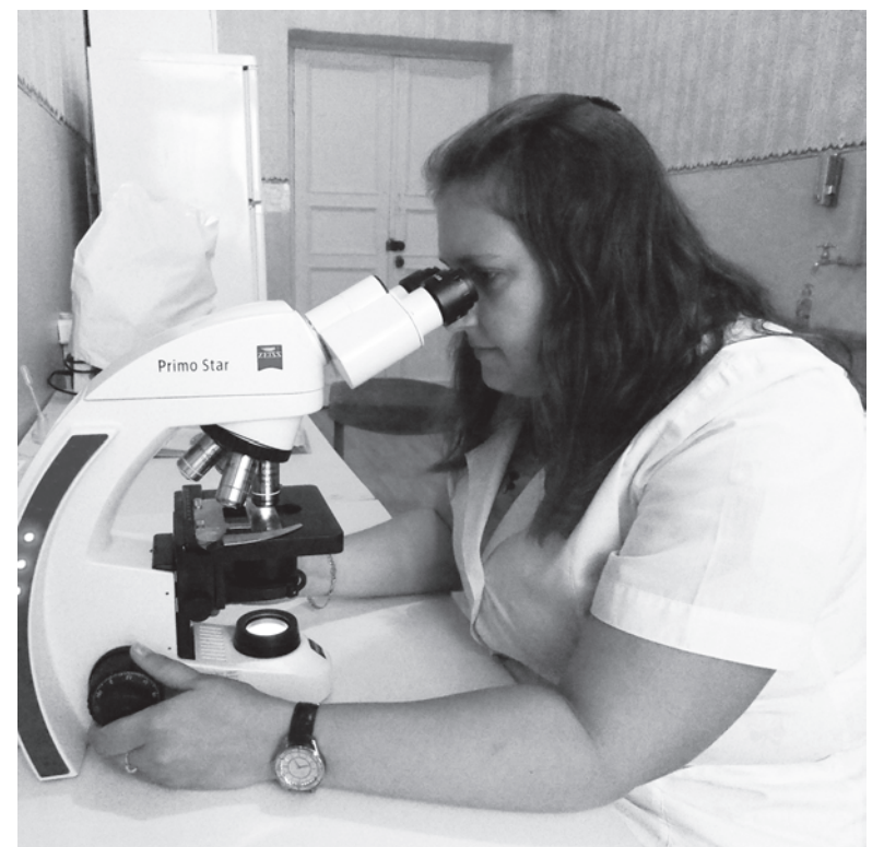
Микроскоп в точности покажет вашу лейкоцитарную формулу