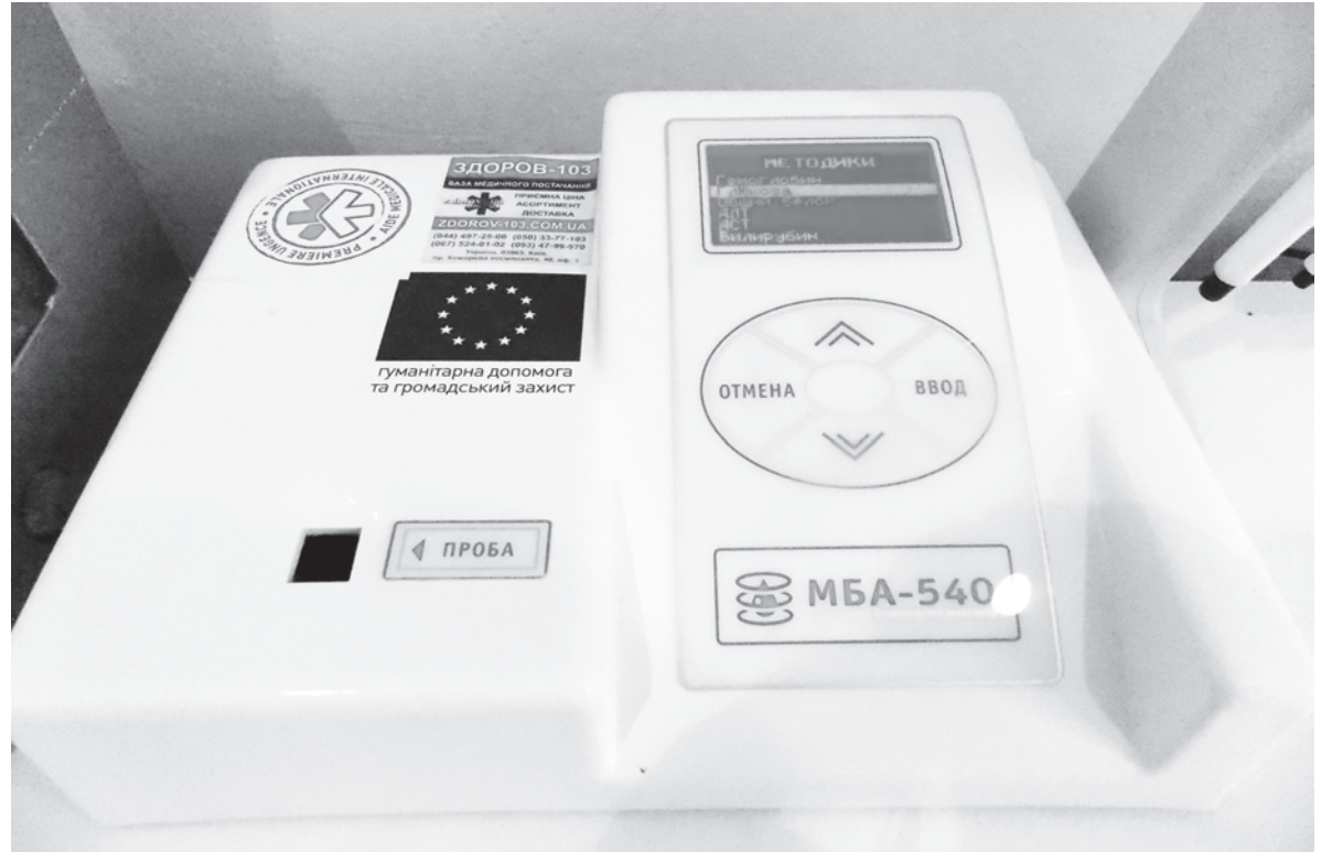
Фотометр МБА-540 – аппарат для измерения глюкозы, белка, билирубина и других исследований

Центр первичной медико-санитарной помощи (ЦПМСП) имеет пять амбулаторий, куда