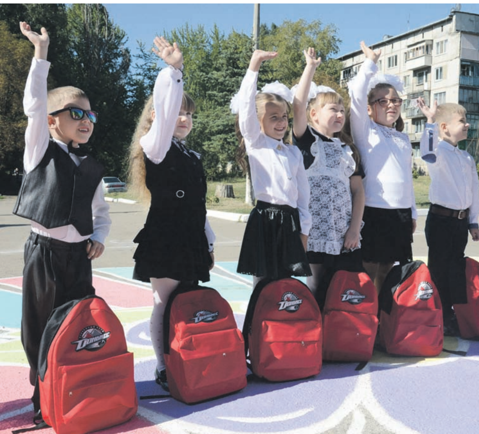
Позитивное впечатление от первого дня в школе – важная составляющая дальнейших успехов

ятно быть причастными к этому событию. Уверен, сувениры, которые ребята получили сегодня, дадут определенный результат: они помогут им хорошо учиться и достигать побед.