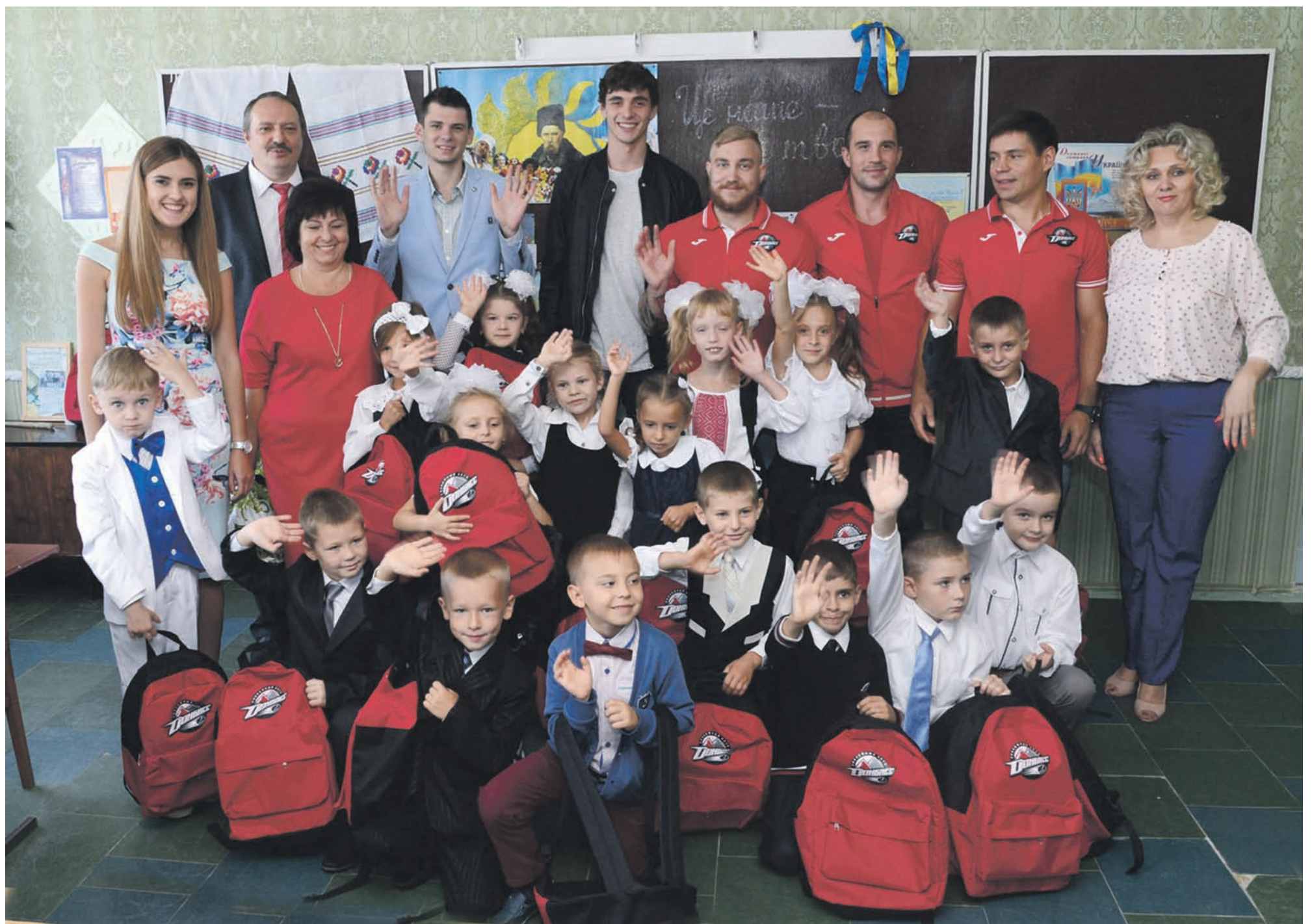
Более 2 300 учеников школ и интернатов городов Донецкой области получили сладкие наборы и сувенирную продукцию в первый день учебы