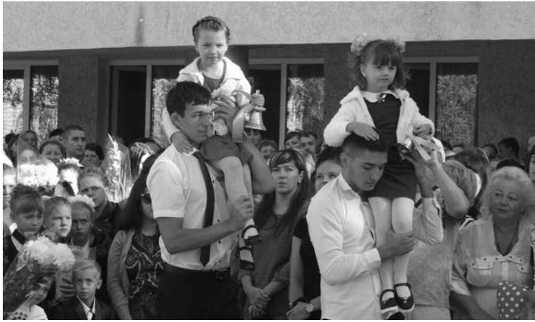
Особое внимание первого сентября в Покровске было приковано к опорной школе, которой стала ОШ №9