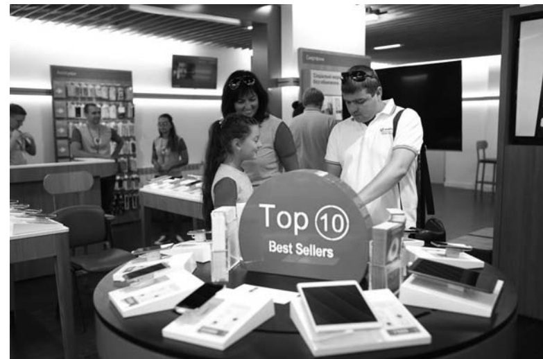
Самая большая ценность магазинов Vodafone – их эксперты

Три кита, на которых построена работа с клиентами: скорость обслуживания, доступность изложения необходимой информации и доверие. Каждый клиент может собственноручно протестировать выставленные в салоне образцы мобильных