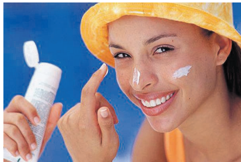
Выбор крема зависит от фототипа кожи