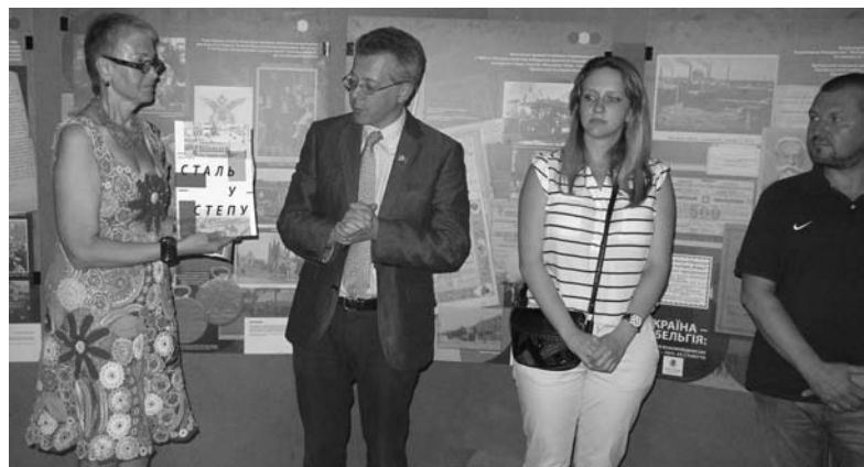
Жан де Ланнуа: «Украине очень повезло, что ее жители говорят на очень похожих языках»

Тридцатого июня Дружковку посетил первый заместитель Чрезвычайного и полномочного посла Королевства Бельгия в Украине Жан де Ланнуа. Его визит был приурочен к открытию выставки, рассказывающей о тесных экономических связях Бельгии и Украины в конце XIX-го – начале XX веков. Господин де Ланнуа, несмотря на плотный график визита, нашел время для общения с журналистом «Знамени Индустрии».