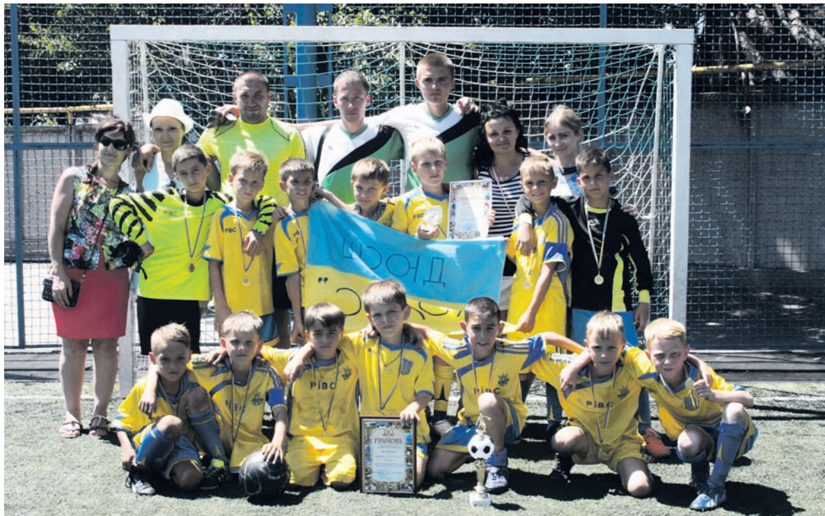
Юные чемпионы вместе со своими самыми верными болельщиками – родителями

Б ердянск стал местом проведения Всеукраинского турнира по футболу среди детей 2007 года рождения и младше на Кубок местного городского головы. За призы боролись десять команд из разных регионов страны.