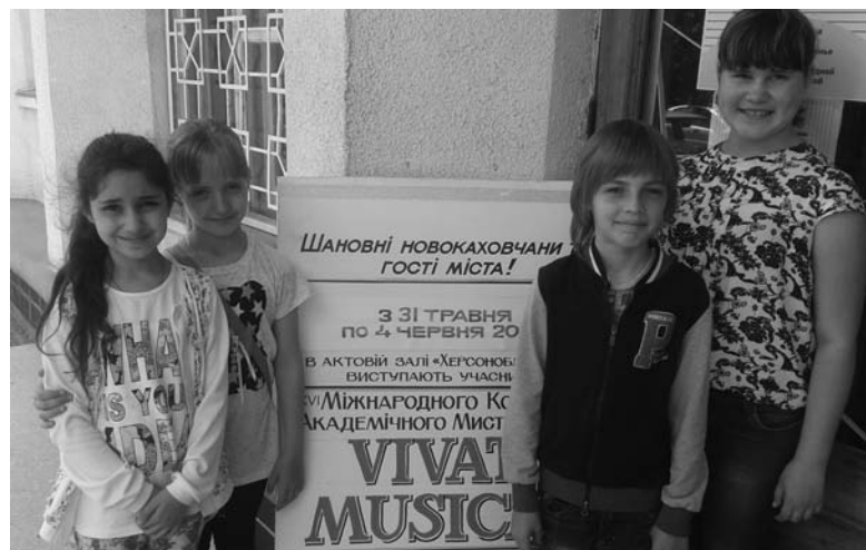
Юные таланты триумфально выступили на Международном музыкальном конкурсе в Новой Каховке

В нынешней сложной экономической ситуации, в условиях войны, при повсеместном психологическом упадке и неверии, самыми незащищенными являются наши талантливейшие дети. Они – надежда, наше будущее, будущее страны. Не так много у нас меценатов, которые соглашаются безвозмездно оказать важную и такую необходимую помощь.