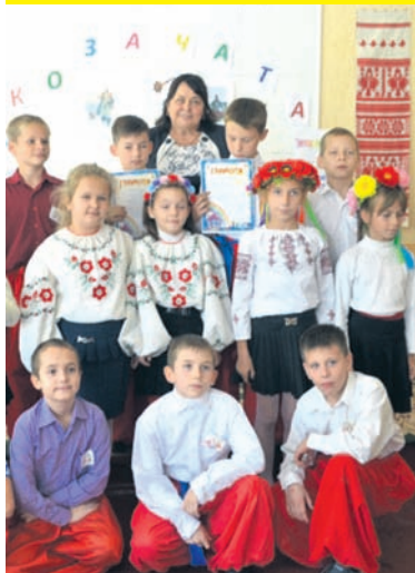
Діти, одягнені в українські костюми, читали вірші, приказки, відгадували загадки, співали