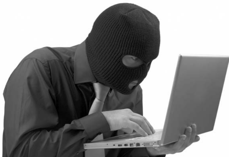
Интернет-мошенничество в последнее время приобретает все больший размах

Предприниматель Краматорска долго листала страницу за страницей своего компьютера в поисках выгодного вложения денег. Пока, наконец, не нашла то, что нужно. Бытовая техника по привлекательной цене ее вполне устраивала с позиции последующей прибыльной перепродажи. И 44-летняя бизнес-леди решила сделать заказ. Магазин, или тот, кто скрывался под его видом, потребовал перечислить