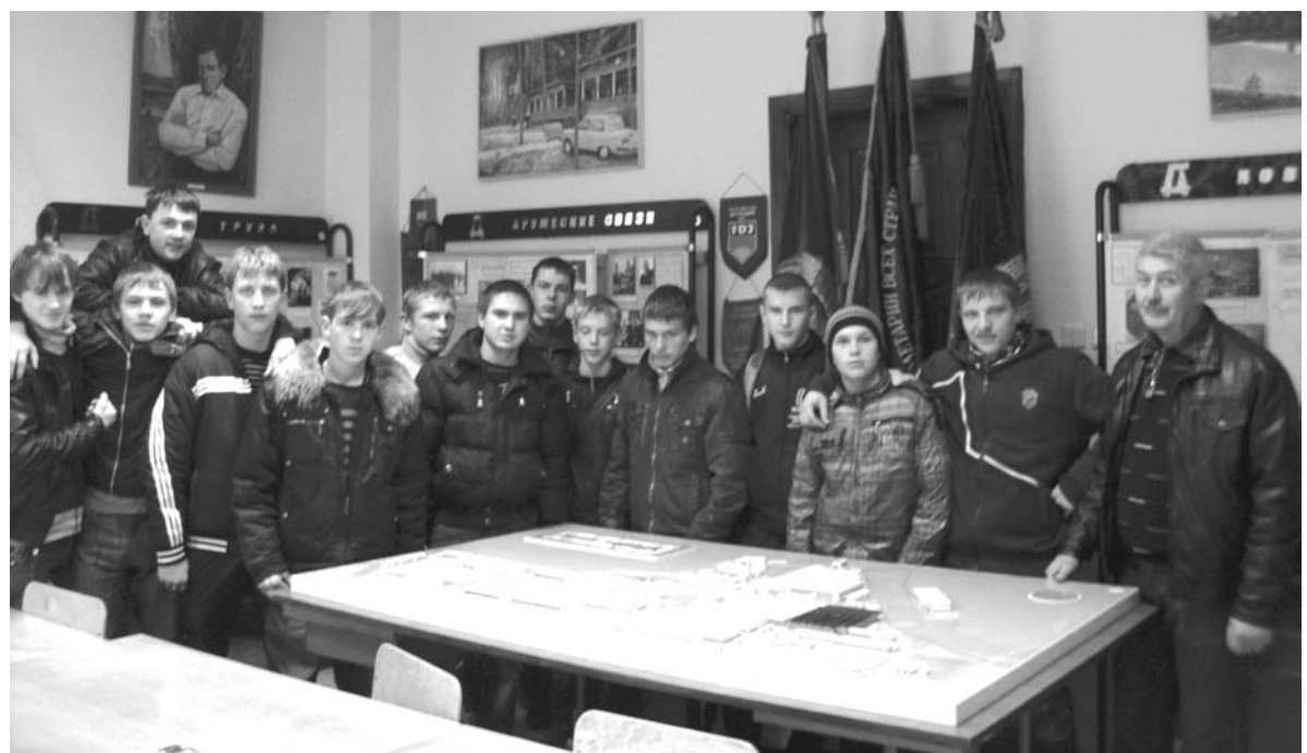
Учащиеся профлицея на экскурсии, в заводском музее