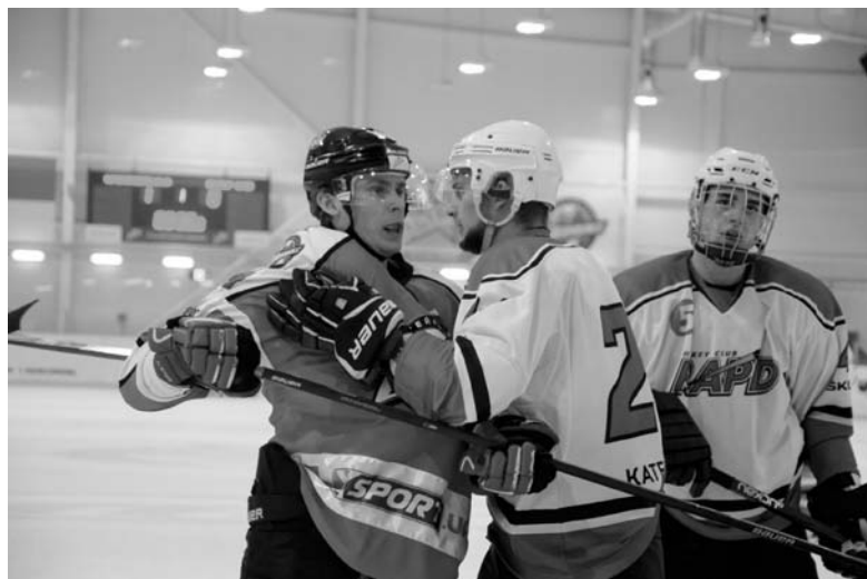
Несмотря на грубую игру «Рапида», игроки ХК «Донбасс» сохранили хладнокровие и заслуженно победили дважды

В итоге Хонин получил удаление до конца матча, пятиминутный штраф, а еще пятеро его партнеров оказались на скамей-