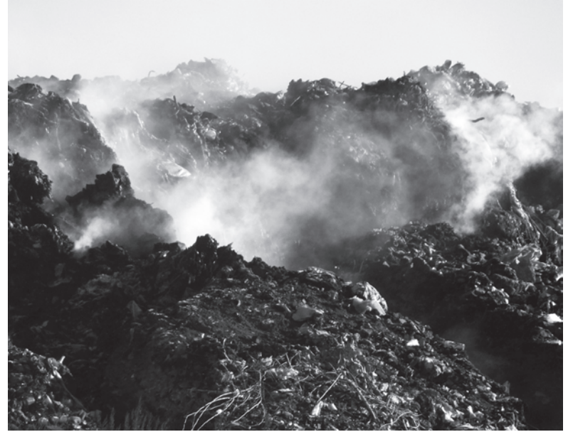
«Марсианский пейзаж» полигона бытовых отходов