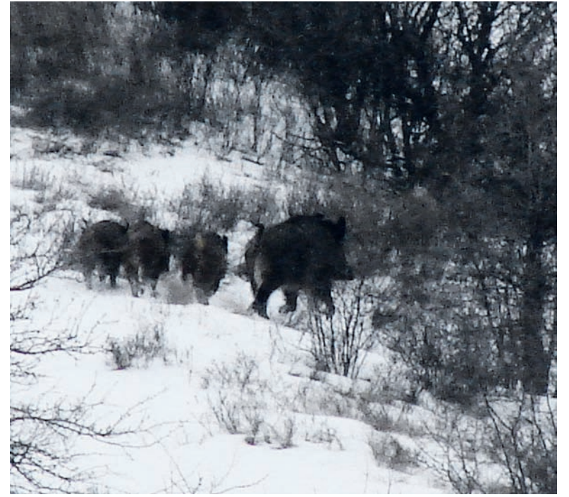
З вини браконьєрів диких тварин стає все менше.

Новий вид браконьєрства – пісочне, з'явився в Україні в останні 10-15 років. Видобуваючи пісок, браконьєри знищують