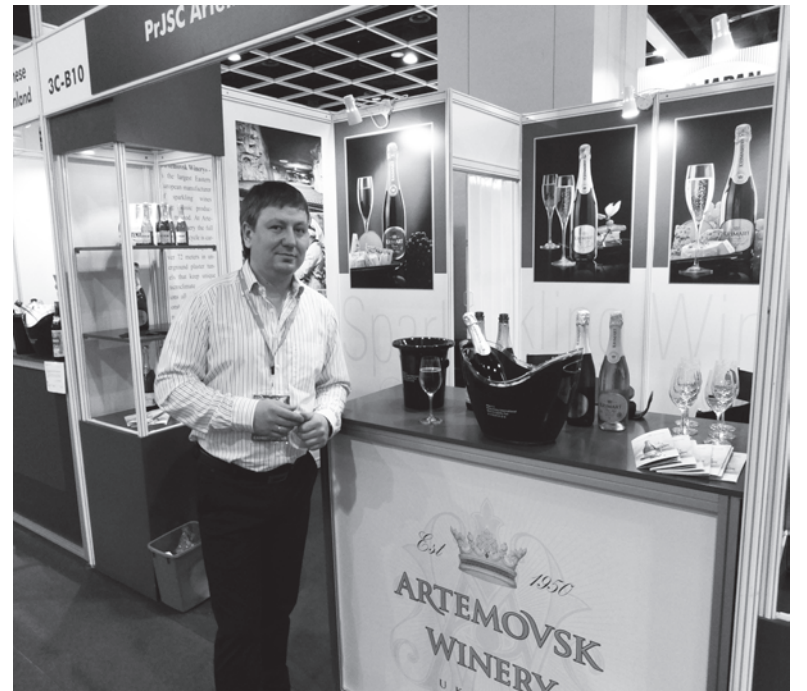
В этом году Artemovsk Winery стал единственным представителем Украины на Hong Kong International Wine & Spirits Fair

Artemovsk Winery уже во второй раз представляет свою продукцию в Гонконге. Дебют Компании на Hong Kong International Wine & Spirits Fair состоялся в 2013 году, где были представлены лучшие образцы торговой марки «KRIMART», а также фруктовая коллекция «Charte Komilfo», моментально завоевавшая сердца посетителей выставки. В этом году сюрпризом для азиатских потребителей стала новинка от «Charte Komilfo» – игристое с ароматом ананаса. А элитные брюты торговой марки «KRIMART», соответствующие европейским стандартам виноделия, получили самые высокие оценки от взыскательной публики и профессионалов из стран