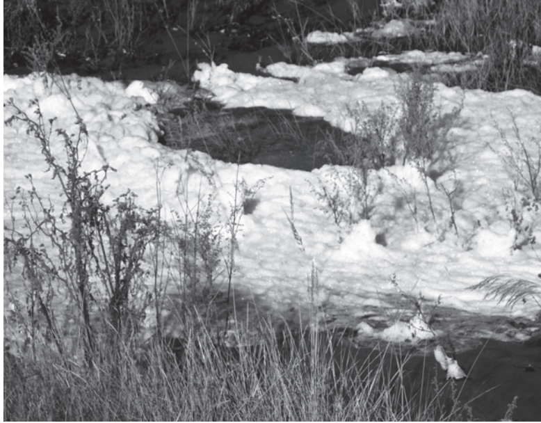
Это не ранний снег, это – пена неизвестного происхождения