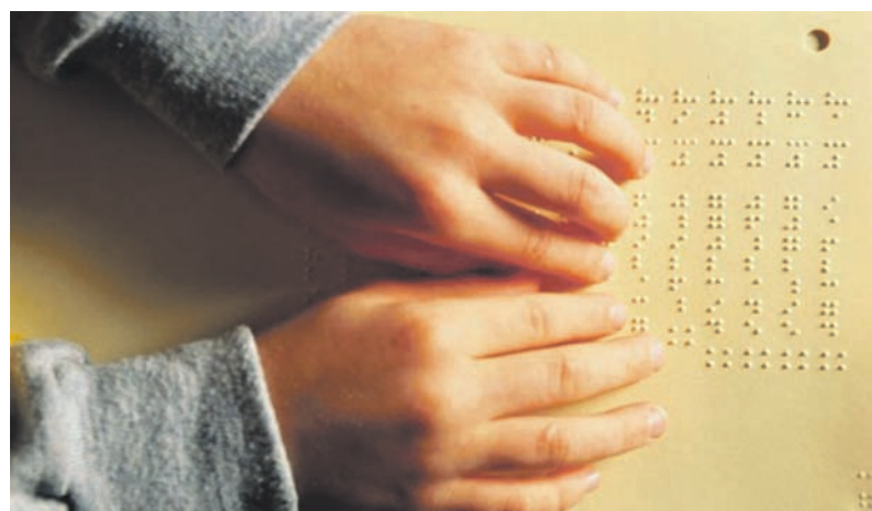
Единственная в регионе школа для детей с проблемами зрения помогает адаптироваться своим ученикам

Школа имеет давние спортивные традиции. Шесть воспитанников стали олимпийскими чемпионами. Ученики интерната входят в состав Национальной Паралимпийской сборной команды Украины. В целом, от 85% до 100% выпускников школы успешно учатся в высших учебных заведениях Украины и в дальнейшем достойно представляют культуру, экономику, педагогику, юстицию нашей страны.