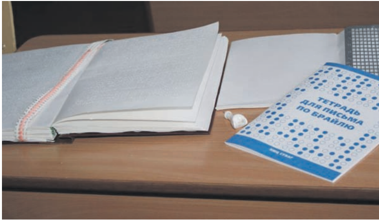
Учебники ребята печатают сами по заказу своих педагогов

Славянская школа-интернат для слепых и слабовидящих детей успешно работает по двум программам: по вспомогательной и для общеобразовательных классов. В Украине таких заведений всего шесть.