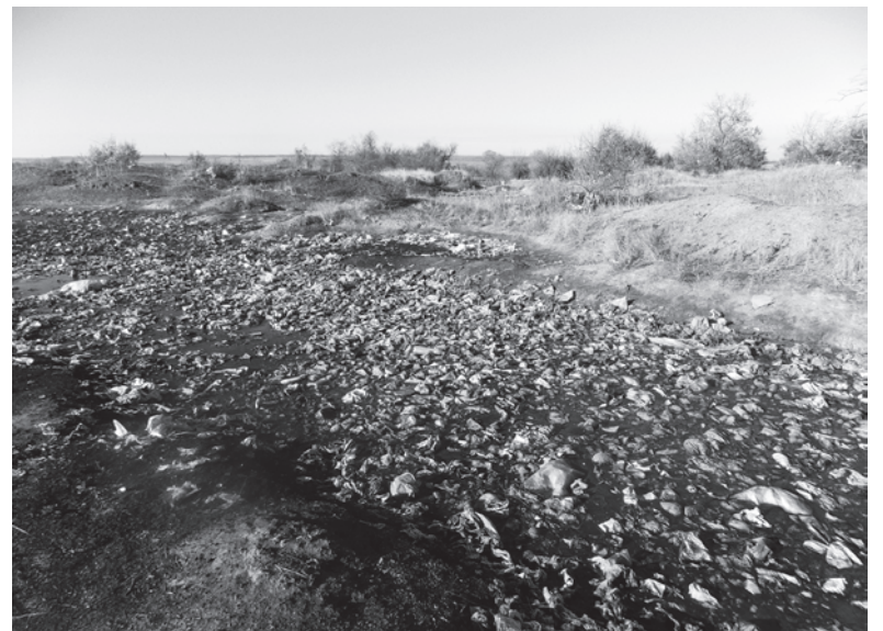
Вместо ручья – мусорное болото

– 24-го ноября должен состояться тендер по реконструкции очистных сооружений. После чего пройдет тендерная процедура. Сами понимаете, за последний год стоимость этих работ резко возросла, поэтому пришлось заново пересчитать смету. На реконструкцию первой очереди очистных выделено 22 млн гривен. А в целом, чтобы привести в порядок объект, по-