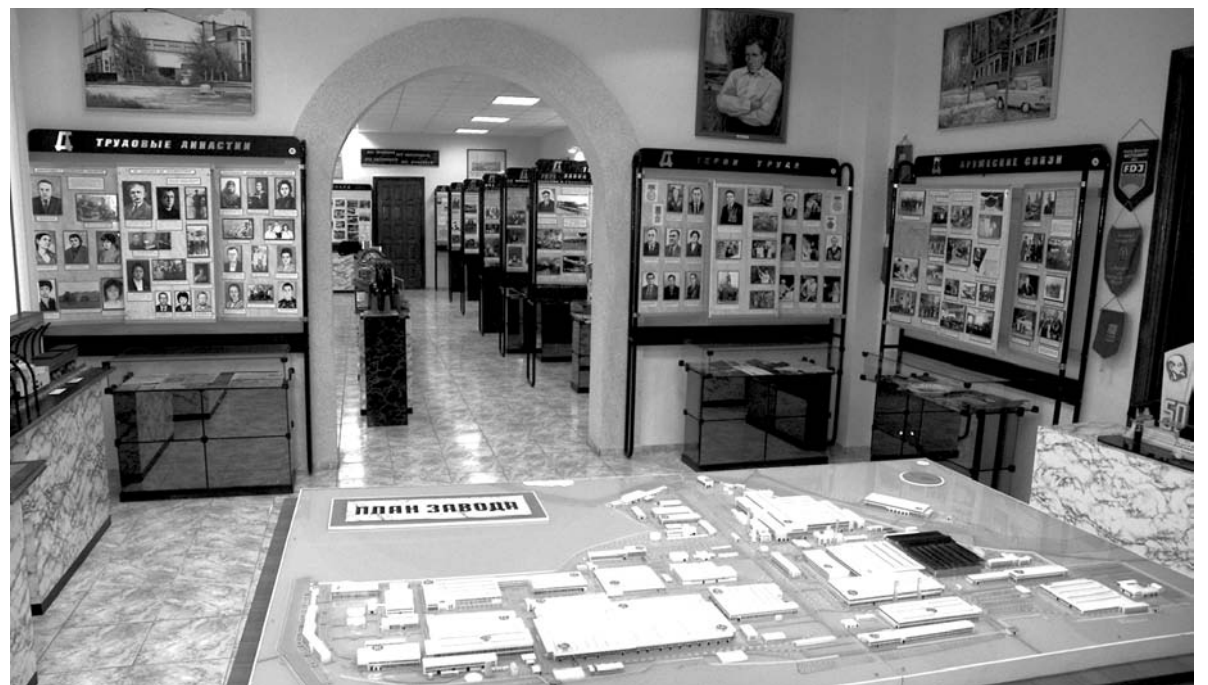
Сегодня в музее хранится 4 850 экспонатов, представляющих историческую ценность

был подтвержден Министерством культуры Украины. Среди его наград: Грамота городского головы за участие в Юбилейной выставке, посвященной 75-летию Донецкой области, Диплом участника Общегосударственной выставочной акции «Барвиста Україна» (г. Киев, 2007г.). Деятельность учреждения была замечена, и оно вошло в реестр промышленных музеев Украины.