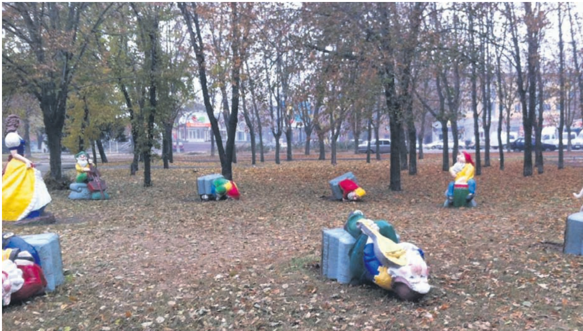
Сказочные персонажи, сделанные из глины, валяются на земле, а на одном из персонажей отбита краска

А вчера проходили мимо и увидели неприятную картину: сказочные персонажи, сделанные из глины, валяются на земле, а на одном из них, таком красивом Маугли, отбита краска. Стало так больно и обидно. И свой труд жаль, а еще больше – малышей, которые придут в