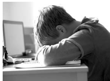
Теперь бы отоспаться