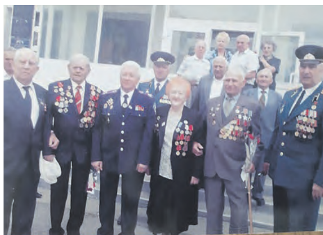
Активисты городских советов ветеранов