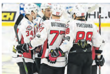
Как победитель регулярки, донецкий клуб автоматически проходит в полуфинал плей-офф