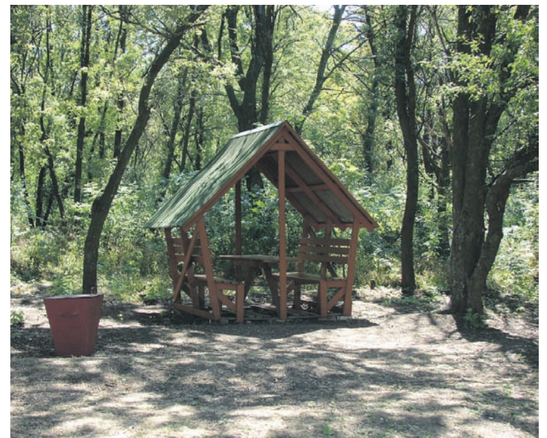
Кошти, отримані від надання послуг, спрямовуються на облаштування нових місць відпочинку та дообладнання існуючих