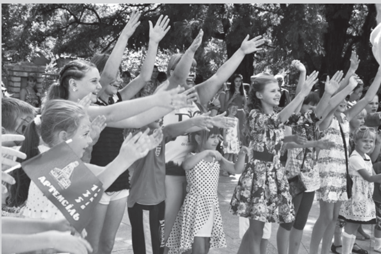
Самыми активными участниками проводимых конкурсов в парке были дети

Выступление украинских звезд эстрады – групп «А.Р.М.И.Я» и «ТИК» – завершили грандиозный 135-летний юбилей «Артемсоли».