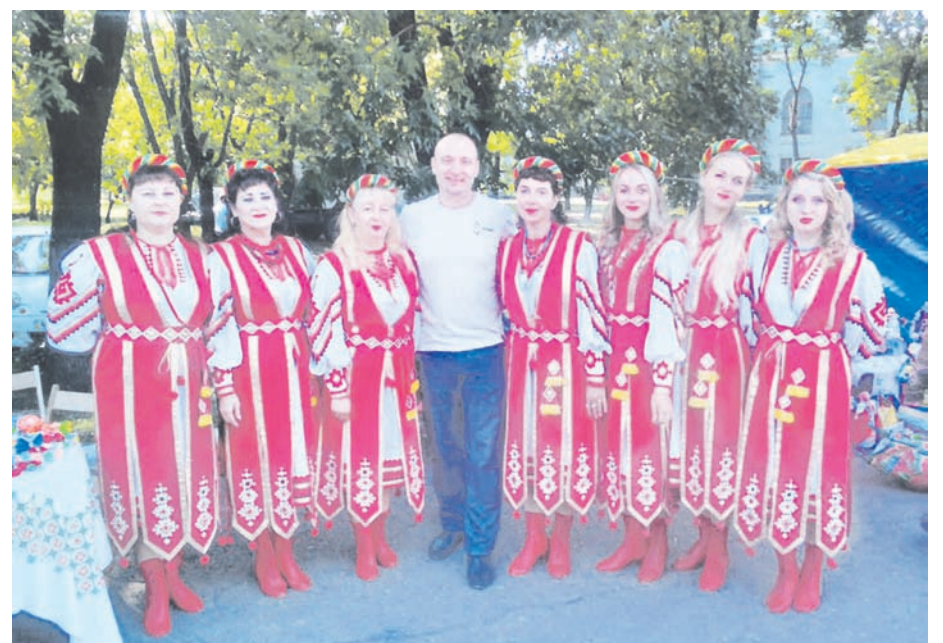
Каждая делегация из сел района выглядела празднично

У Дворца культуры было организовано несколько тематических площадок: фото-выставка, соревнования по армрестлингу и перетягиванию каната. Любители хорового пения исполнили любимые песни, а гитарного – посидели у импровизированного костра. Закончилось празднование лазерным шоу и дискотекой.