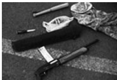
«Воры в законе» приехали не с пустыми руками

Первый кортеж криминального мира был остановлен 27 августа. «Воры в законе» приехали не с пустыми руками, при осмотре их машин сотрудниками полиции были изъяты: охотничье ружье, патроны, биты. 40 человек были доставлены в Славянский отдел полиции для установле-