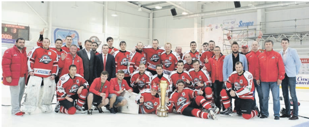
Кубок – у ХК «Донбасс»!