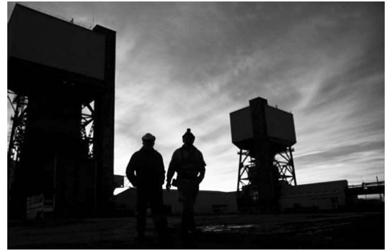
В недрах загорелся метан, есть пострадавшие

Журналистам ЗИ удалось побеседовать с очевидцами трагедии. Шахтеры сообщили, что на самом деле взрыв был не один. За четыре-пять дней до ЧП в тупиковой части выработки участ-