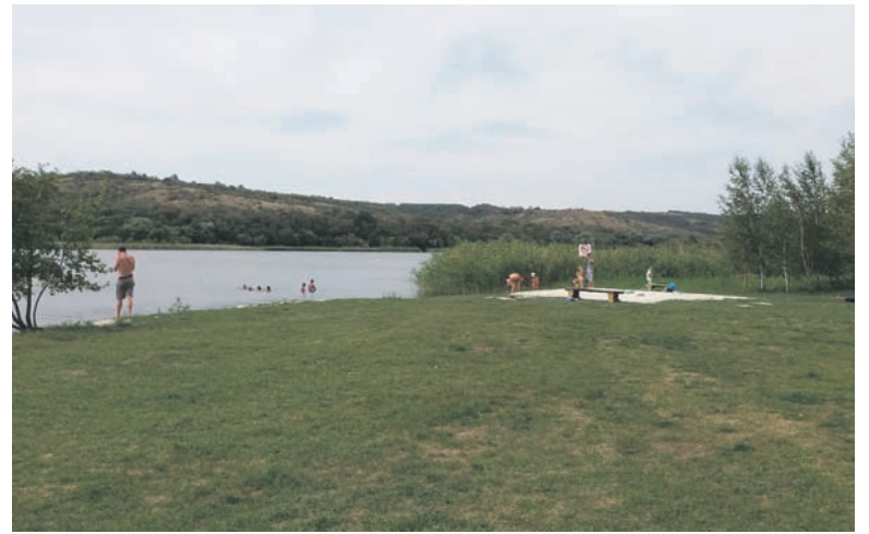
Відпочинок в зоні стаціонарної рекреації платний