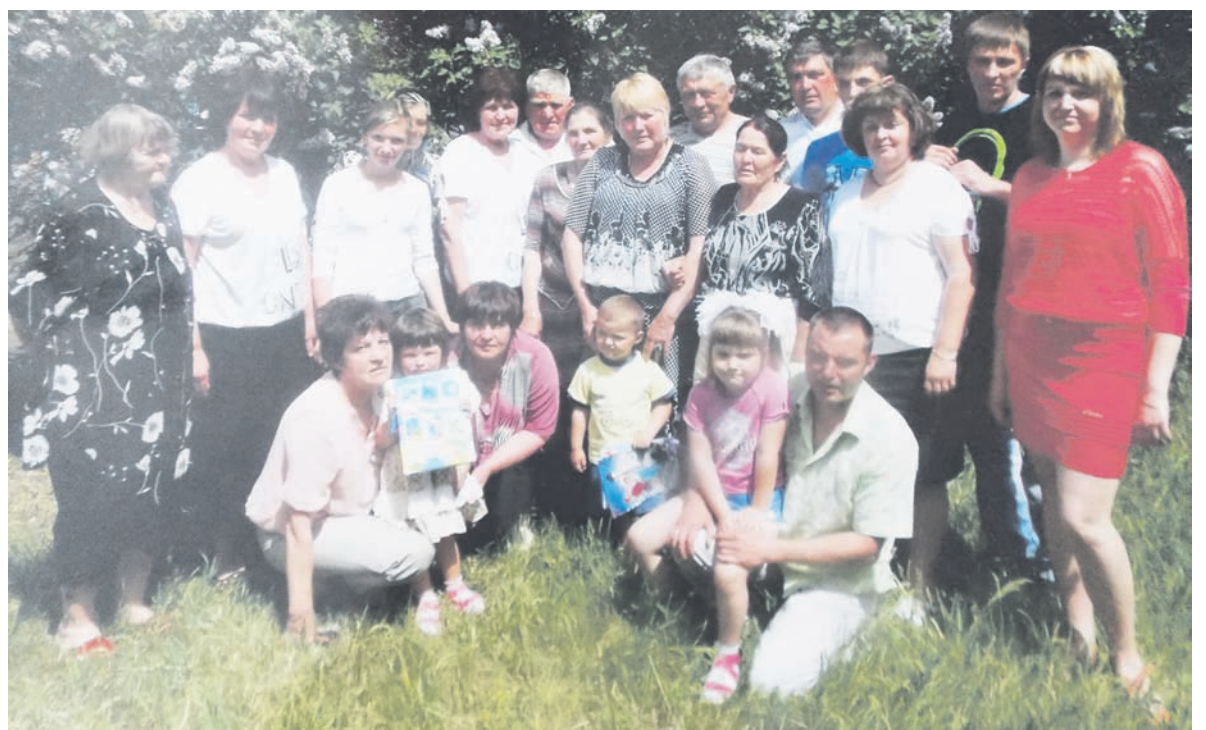
Многие родственники семьи Шиховых работают на сельхозпредприятиях области