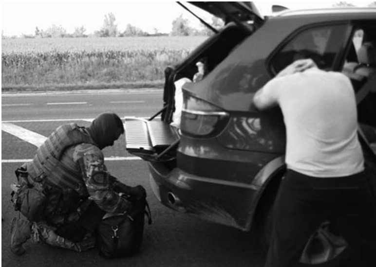
Многих «гостей» полиция задержала на подъезде к Святогорску

криминальной полиции ГУНП в Донецкой области совместно с представителями СБУ была организована тщательная проверка лиц и транспорта на въезде в курортную зону.