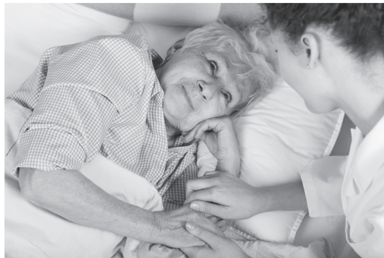
Родная моя, я буду с тобой!