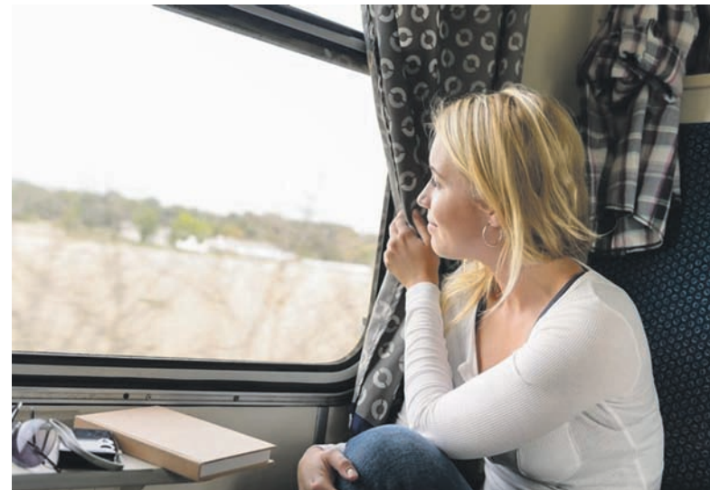
Сервис в украинских поездах не всегда устраивает пассажиров

Постановление Кабинета министров Украины от 19.03.1997г. № 252 гласит: «В купейных, плацкартных и мягких вагонах пассажиры всех поездов не менее трех раз в день обеспечиваются чаем, круглосуточно – кипяченой горячей и охлажденной водой, а в общих вагонах – питьевой водой. Медикаменты из аптечки вагона в целесообразном