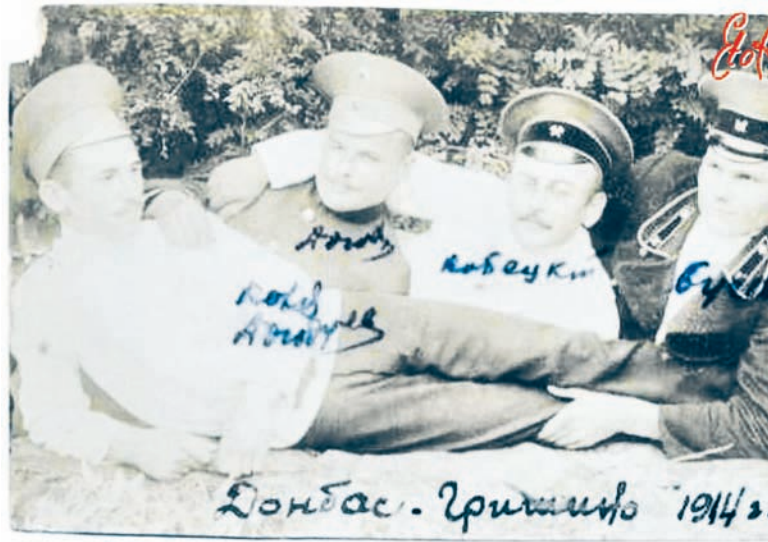
Фото на память: жители Гришино в 1914 году

До 1890 года поселок считался железнодорожным. Постепенно в Гришино появились заводы (чугунолитейный и пивоваренный), паровые мельницы. Через десять лет уже работали