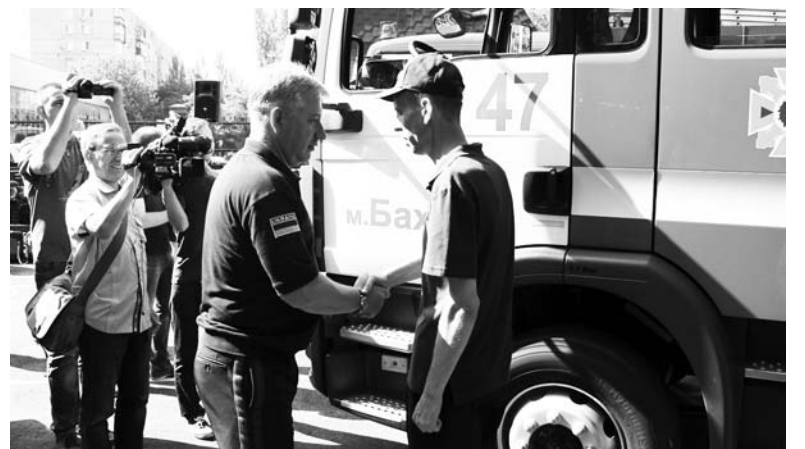
В город прибыл пожарно-спасательный автомобиль MAN

Для города, расположенного вблизи линии разграничения, весьма важно иметь хорошую материально-техническую базу. Спасатели Бахмута регулярно выезжают в прифронтовые поселки.