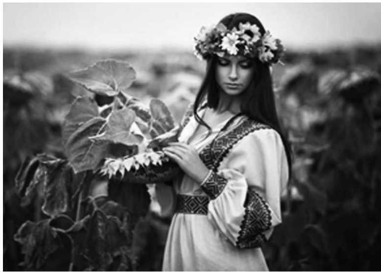
Символом нашей страны многие называют подсолнечник

Сегодня, 24 августа, наше государство отмечает 25-летие со Дня провозглашения Независимости Украины. Предлагаем Вашему вниманию ряд познавательных фактов, о которых Вы, возможно, не знали.