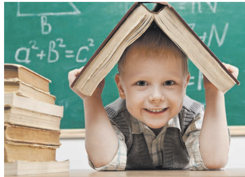
Подготовка к школе должна проходить мягко и ненавязчиво

Подготовка к школе должна проходить мягко и ненавязчиво. Например, прогуляйтесь до учебного заведения. Покажите ту дорогу, по которой будущий