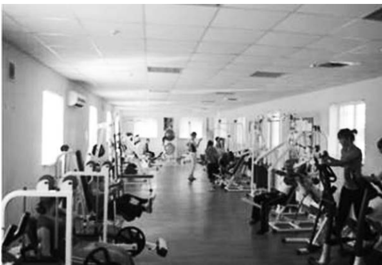
Физкультурно-оздоровительный комплекс «Олимпийский» при УВК

Заведение постоянно участвует в различных проектах, направленных на развитие профессио-