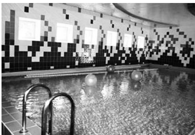
Бассейн в учебно-воспитательном комплексе