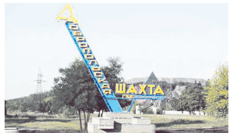
98,9% всей продукции, выпускаемой предприятиями города, – уголь

род областного подчинения (население уже 25 000 человек).