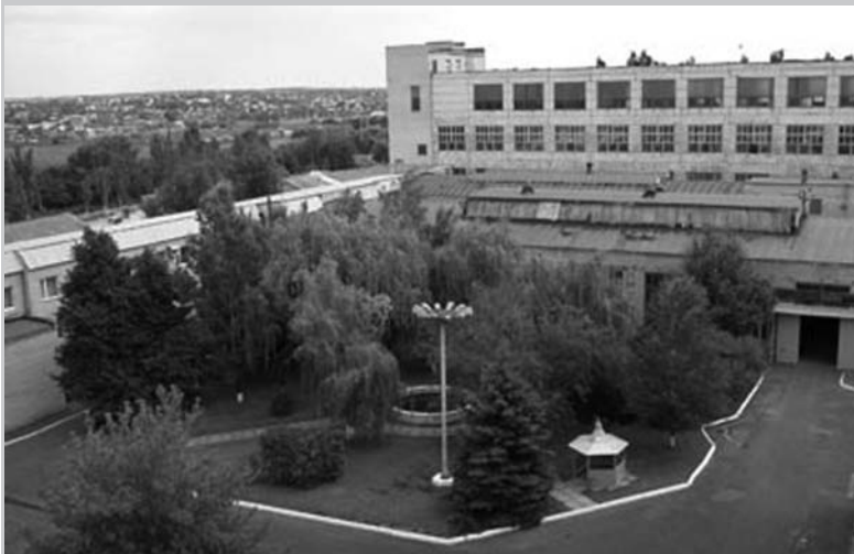
ЗАО «Артемковский электротехнический завод»

В сентябре 2016 года ЗАО «Артемковский электротехнический завод» будет отмечать свой 80-летний юбилей.