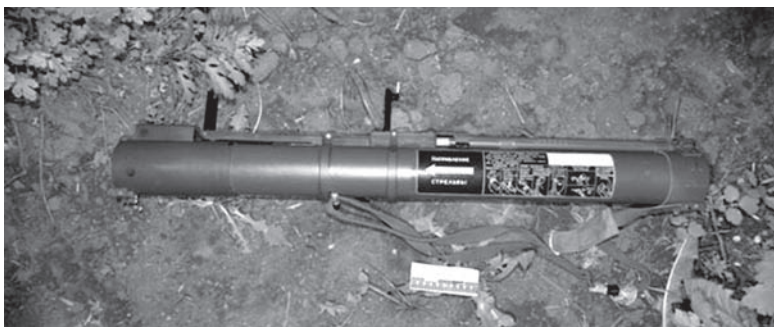
Тубус из-под гранатомета нашли у преступников

Как сообщает отдел коммуникации ГУ НП в Донецкой области, сигнал о происшествии поступил в полицию в пять утра от продавца продуктового магазина, который расположен на первом этаже двухэтажной пристройки к высотке. На втором – находится отдел миграционной службы. Именно эти помещения и «пострадали» от двух выстрелов из ручного противотанкового гранатомета РПГ-22. В зданиях «посыпались» стекла, магазин лишился торговой витрины, а в