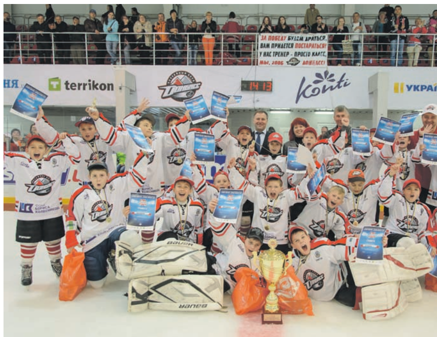
Счастливые победители турнира – команда «Донбасс 2006»

– Сегодня своими выступлениями вы делаете историю, закладывая будущее данного вида спорта в Украине. Я искренне вас поздравляю и желаю добиваться новых побед в предстоящих со-