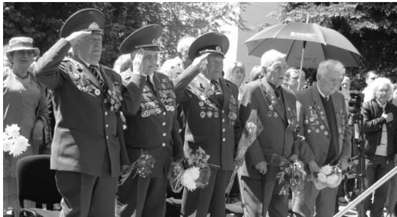
Немногим из участников той войны хватает сегодня сил, чтобы прийти на митинги

Утром 9 мая череда праздничных мероприятий началась с открытия обновленной стелы погибшим воинам на центральном кладбище. Затем в Свято-Михайловском храме духовенство отслужило панихиду по усопшим. Общегородской митинг в этом году решили провести возле памятника Маршалу Советского Союза Ки-