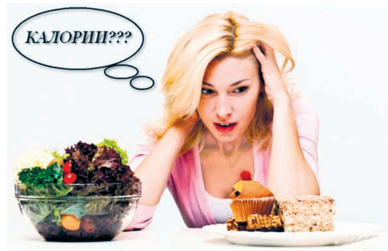
Обратная сторона праздников - лишний вес

3. Пусть ужин состоит из продуктов, богатых клетчаткой: овощей, фруктов. Можно съесть нежирный творог, овощное рагу или рыбу, приготовленную в пароварке. Чтобы вечером не преследовало чувство голода, выпейте перед сном стакан кефира, а сам ужин запланируйте за два