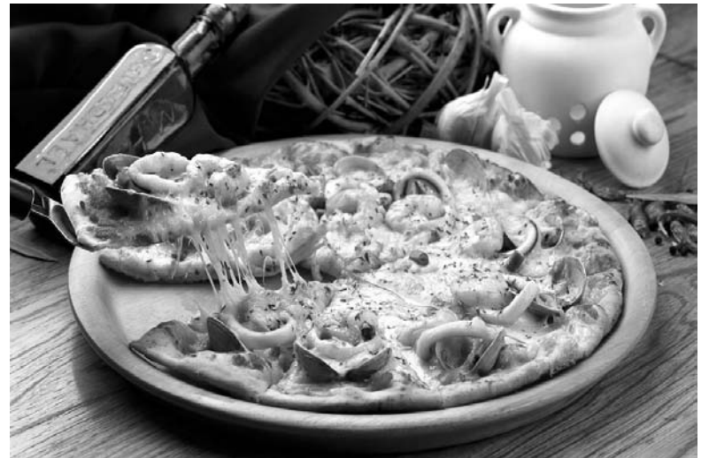
Для начинки пиццы «Морской бриз» используются морепродукты

Прошлые публикации советов и рецептов были посвящены выпечке куличей и приготовлению салатов. Но я – профессионал по выпечке пицц, ежедневно их готовлю десятками и теперь делюсь своими секретами с читателями. Вначале, как всегда, несколько советов. Прежде чем наполнять изделия из теста начинкой, оно должно подойти на противне, где-то минут 20. Если начинить сразу, пицца получится сухой. Сколько времени печь и при какой температуре, сказать нельзя. У каждой хозяйки своя духовка. Определять готовность изделия можно по румяным бочкам и расплавленному сыру. Пиццу лучше есть горячей, в таком виде она гораздо вкуснее. Но если уже надо сохранить ее какое-то время, то надо накрыть ее пищевой пленкой. Вот мои рецепты.