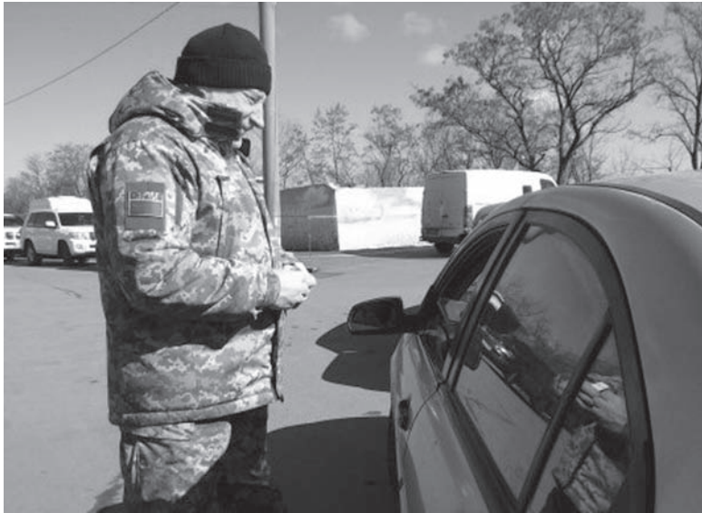
Контрабанда – частое явление на блокпостах

Помимо того, что народ едет с поддельными документами или без таковых (38 случаев), так еще и пытается провезти оружие (8 единиц), взрывчатку (почти 9 кг), боеприпасы (9 тыс. единиц). Вместе с фискальщиками пограничники выявили и изъяли товаров и продуктов питания на общую сумму 32 миллиона гривен. Впрочем, и сами денежные