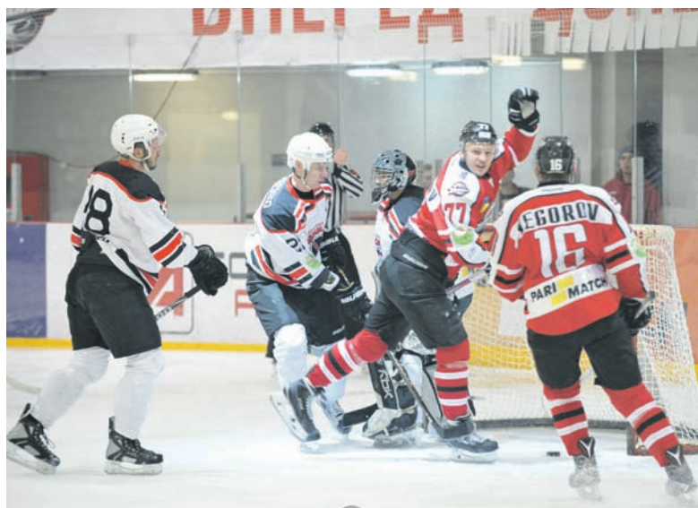
Весь матч «Донбасс» атаковал ворота «Дженералз»