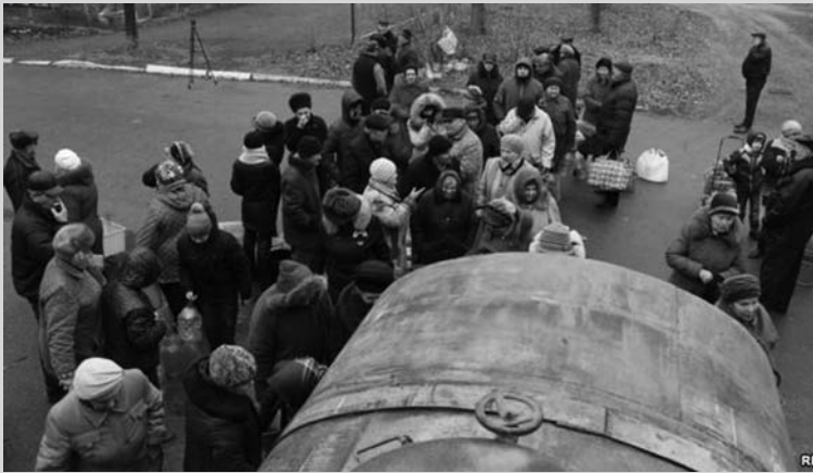
Ситуация в городе остается напряженной

На территории Торецкого водовода действует режим тишины. Как сообщили в исполкоме горсовета, ремонтными бригадами разрешено осуществлять работы в течение трех дней с 9:00 до 16:00. С момента аварии прошло уже восемь суток.