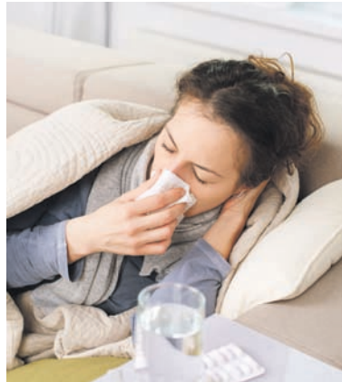
Число людей с простудными заболеваниями увеличивается с каждым днем

Всего полмесяца назад уровень заболеваемости в городе не превышал 52 % от установленного эпидпорога. На прошлой же неделе этот показатель составил уже 30 %, то есть количество горожан «сдавшихся» под на-