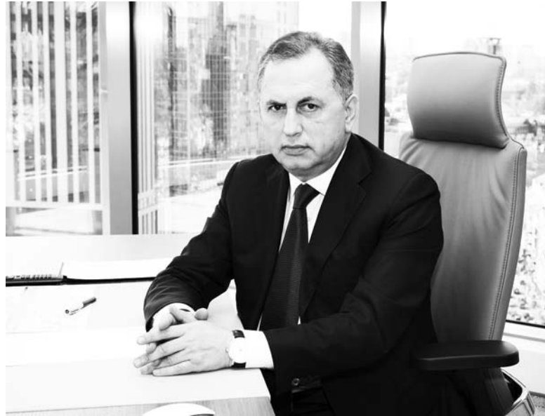
«Необходимо, чтобы максимальное число избирателей приняло участие в выборах громад», – уверен премьер-министр Оппозиционного правительства Борис Колесников

Что касается областей. Сколько их должно быть? Ответ – сколько мы готовы потратить на содержание областных органов власти. И какие у них будут полномочия? Местные советы должны делегировать им полномочия, с которыми сами не справляются. Это управление медицинскими центрами межрегионального уровня. Крупные театры, музеи – безусловно, это полномочия, которые нужно передавать в центр области или региона. Дороги областного и межобластного значения могут быть у области и региона. Все остальное – это задачи местного самоуправления. Но если, например, мы хотим