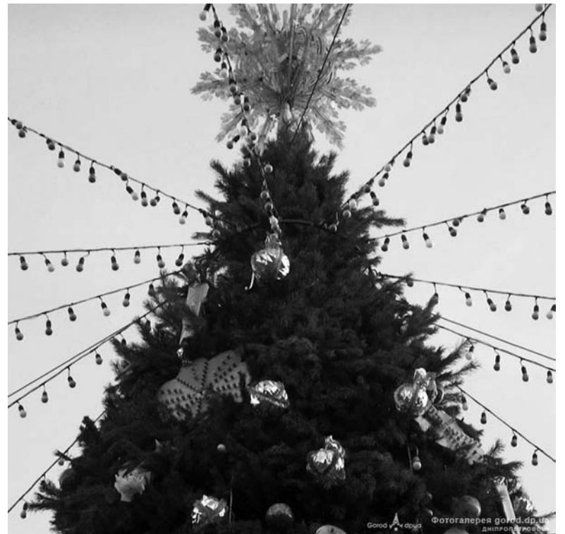
У каждого города будет своя новогодняя ель