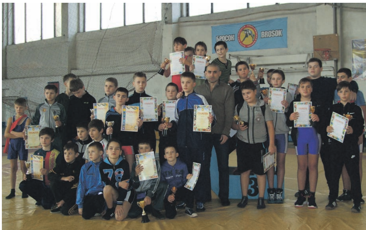
Мастерам растет достойная смена!