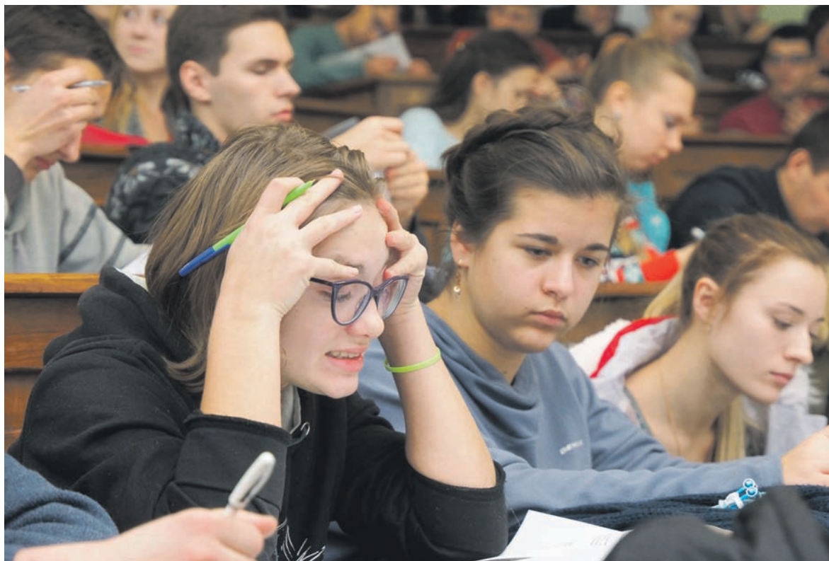
У студентов в первом туре был ровно час для того, чтобы они могли показать свои знания в точных науках и пройти во второй тур конкурса, который состоится в январе 2017 года

– Этот конкурс очень важен для Украины и украинской молодежи. В последнее время и государственные, и правительственные органы, по моему мнению, неправильно ориентируют молодежь в получении образования. Политология, социология и философия – важные специальности, но именно технический прогресс принесет успех Украине и миру. Необходимо, чтобы наши студенты были готовы к нему и четвертой волне индустриализации, когда ведущие западные государства возвращают производства в свои страны и вкладывают в экономику огромные деньги. У нас есть инженерные таланты и кадры на сегодня, завтра и послезавтра, а этот конкурс и техническое образование принесут молодым людям успех в жизни,