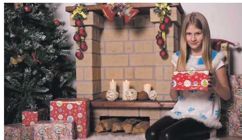
Украшение дома следует продумать заранее

Приветствуются все оттенки красного, ярко-оранжевого и зеленого цветов.