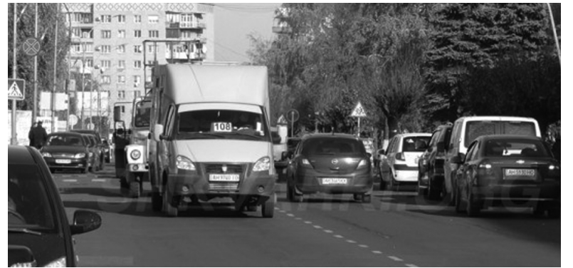
Депутаты Покровска решили «поставить на место» монополистов-перевозчиков