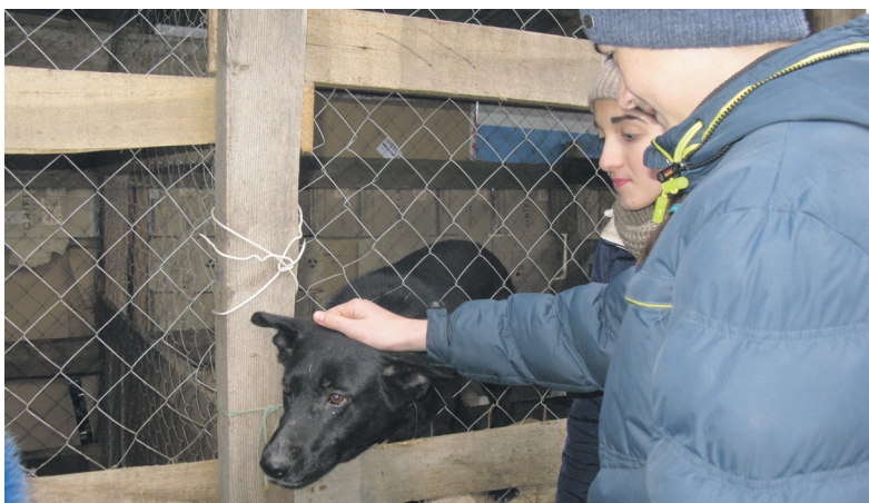
Во время экскурсии школьники смогли пообщаться со своими «подшефными»

В школах Краматорска завершилась месячная акция по сбору средств помощи приюту для бездомных собак, содержанием которого в городе занимается благотворительный фонд «Друг».