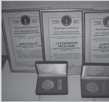
Награды, привезенные с престижной международной выставки

По итогам участия в выставке НКМЗ награжден дипломом «За долголетнюю стабильную поставку на российский рынок высококачественного металлургического, прокатного и кузнечно-прессового оборудования». По решению конкурсной комиссии НКМЗ назван в числе лучших предприятий, разработавших и внедривших