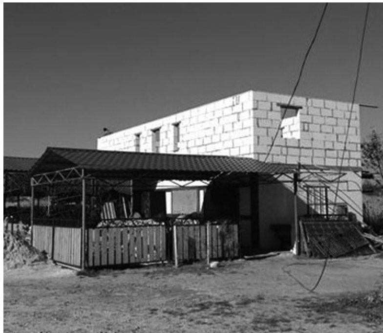
В региональном ландшафтном парке «Славянский курорт» выявлен факт незаконного строительства