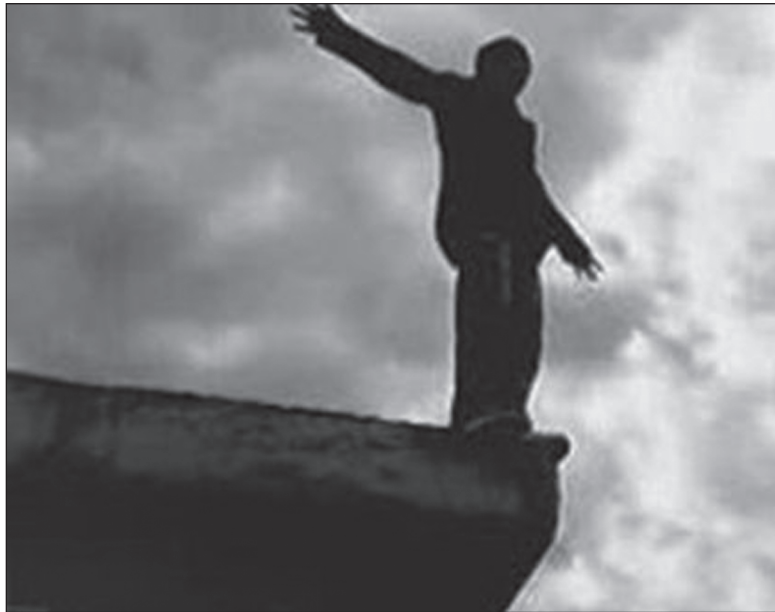
Пытаясь сбежать от полицейских, преступник решил прыгнуть с крыши родительского дома

Мать-инвалид по слуху и ее 49-летняя дочь проживали одни в частном доме, в районе Центрального рынка. О том, что женщины одиноки, незащищены, возможно, имеют скромные финансовые накопления, стало известно 25-летнему парню. Он жил напротив, в пятиэтажке, и отслеживал частную жизнь женщин с высоты своего балкона. Ночью злоумышленник разбил окно в спальне дочери. Совершив надругательство над женщиной, преступник забрал у нее последние 200 грн. и телефон.