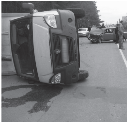
У водителя остановилось сердце

По предварительному выводу экспертов, у него во время движения произошел сердечный приступ, от которого он