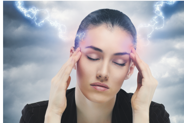
От метеозависимости сегодня страдает много людей

Атмосферное давление. Вся система кровообращения нашего организма связана с атмосферным давлением, перепады которого, в первую очередь, влияют на сердечно-сосудистую систему. При повышении барометрического давления артериальное давление падает, а часто-