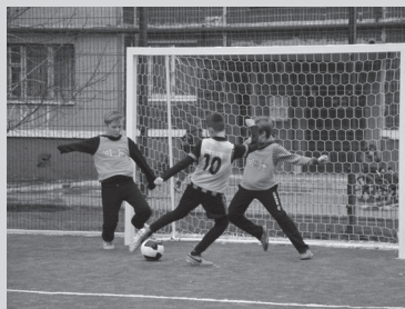
Мини-турнир на новой спортплощадке

Работы финансировались в рамках социальной программы «НКМЗ для Краматорска». Новая спортплощадка открыта для всех детей микрорайона. Ребята