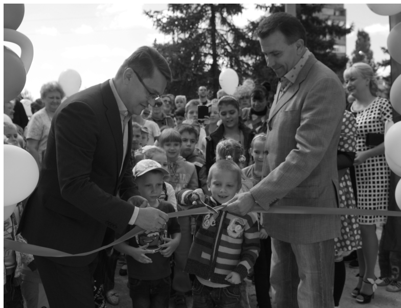
В Дружковке 17 сентября, во время празднования Дня города, состоялось торжественное открытие двух детских площадок, построенных UMG в рамках реализации программы социального партнерства с Дружковским городским советом

Уже много лет глинодобывающие предприятия UMG работают как ответственный бизнес. Это не дань моде – это часть стратегии развития компании, направленной на улучшение условий труда и отдыха своих сотрудников, а также повышения качества жизни людей на территории присутствия глинодобывающих предприятий.