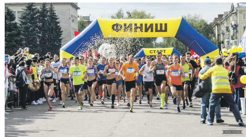
В полумарафоне участвовали более 1 300 человек!

лась колонна байкеров, к прибытию которой на площади уже начались показательные выступления по автослалому.