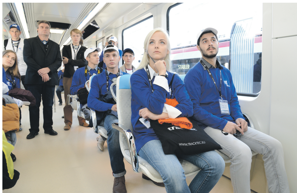
Студенты не только увидели новинки машиностроения, но и смогли почувствовать себя в качестве пассажиров