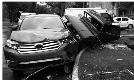
Вот что бывает когда нарушают ПДД

Как объясняет владелец иномарки, авария произошла из-за того, что сидящий за рулем ВАЗ-2107 мужчина не уступил право проезда, в результате чего протаранил «Тойоту». Кто прав, кто