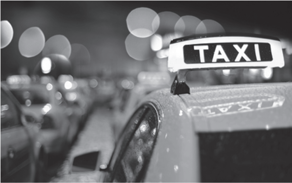
Наш корреспондент 15 раз проехала в краматорских такси и смогла получить только три чека...

Первым на удачу выбрали службу «Удача». Водитель не знал, что такое управление соцзащиты, только когда пассажир попросил подвезти к «собесу», повез на улицу Лазо к главному корпусу УСЗН. За 4 километра взял 35 грн.: 15 грн. – первый километр, двадцать – за три с небольшим. Чек не дал, сказал, что в их службе таковых просто нет. Следующим был вызов «Свое такси». Водитель приехал минут через пять, за несколько секунд диспетчер предупредил, что надо выходить, машина подъезжает. До управления Пенсионного фонда, что по улице Почтовой, 5 (7 км), доехали за десять минут. Водитель обиделся, что я его «Ниссан» назвала «Ланосом», взял 44 гривни и дал чек, красивый такой, с календариком на обратной стороне. Дальше я попыталась вызвать такси «Любимое», но свободных машин на тот момент не оказалось. Дозвонилась в «Кра-