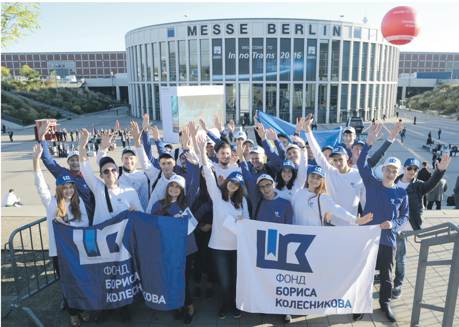
Молодежь благодарна организаторам проекта «Железнодорожник-2016» за возможность получить бесценный опыт и знания

– Важно, чтобы ребята увидели своих коллег, самые современные достижения в плане развития железных дорог,