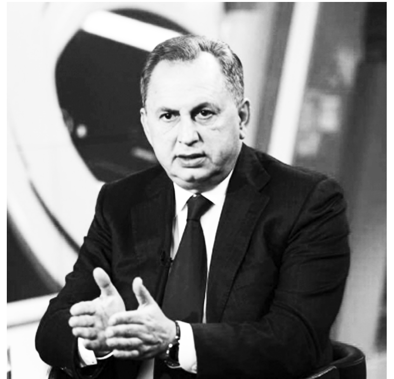
Борис Колесников: «Если начнем производить готовую продукцию, а не продавать сырье, то сможем за 2-3 года кардинально изменить ситуацию в экономике»

Лидер оппозиционеров подчеркнул, что необходимо развивать промышленность и проводить новую индустриализацию. «На востоке страны – в Харькове, Днепропетровске, Краматорске и Мариуполе – лучшая машиностроительная школа Восточной Европы. Но этим надо заниматься. А власть хвастается тем, что