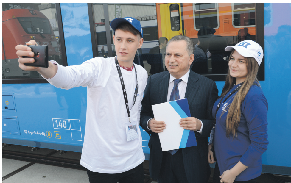
Как же без фото на память с Президентом Фонда Борисом КОЛЕСНИКОВЫМ?!

С этим трудно не согласиться. Ведь такая мотивация и является лучшим стимулом для молодого поколения украинцев выбирать инженерные специальности, стремиться быть лучшими в этом направлении. А это значит, что проект «Железнодорожник» – это огромная инвестиция в развитие науки и образования Украины, в перспективы и будущее страны.