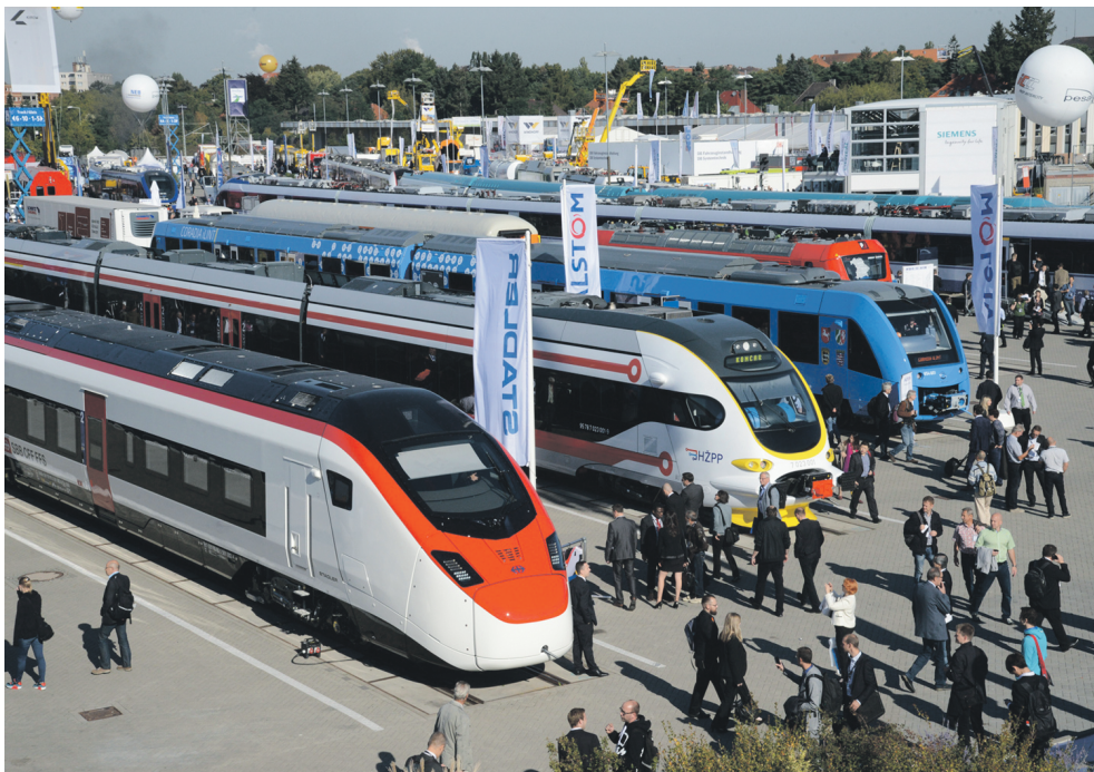
В InnoTrans 2016 приняли участие три тысячи экспонентов из 60 стран мира