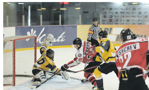
Момент игры «Донбасс» - «Белый Барс»