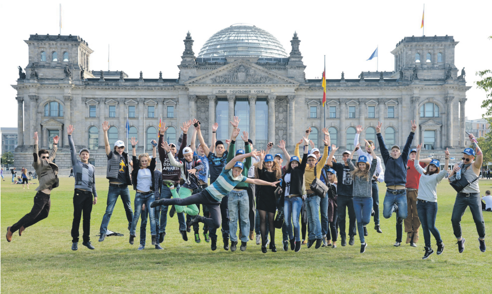
Прогулка по Берлину подарила незабываемые впечатления от пребывания в Германии