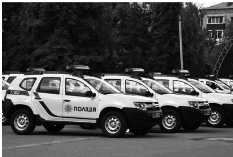
Внедорожники станут идеальным служебным транспортом

Как отметил Арсен Аваков, 52 новых кроссовера предназначены не только для патрульной полиции, но и для сотрудников других подразделений. Благодаря функции полного привода, внедорожники станут идеальным служебным транспортом