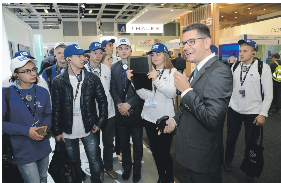
О технологиях будущего ребятам рассказывали лидеры мировых производителей железнодорожного транспорта

только одного взгляда на выставочный павильон, чтобы понять: впечатлений будет более чем предостаточно. Тысячи экспонатов из 60-ти стран мира, последние разработки от лидеров мирового машиностроения – Alstom, Bombardier, Siemens и других, – возможность узнать все особенности производства – это был предел мечтаний молодых железнодорожников, которые до недавнего времени обо всех