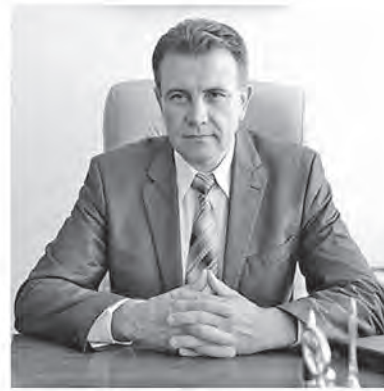
Народный депутат Украины

Член депутатской фракции "Оппозиционная платформа - За життя"