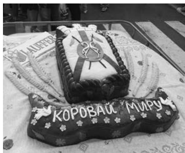
Сюрприз от местного хлебозавода