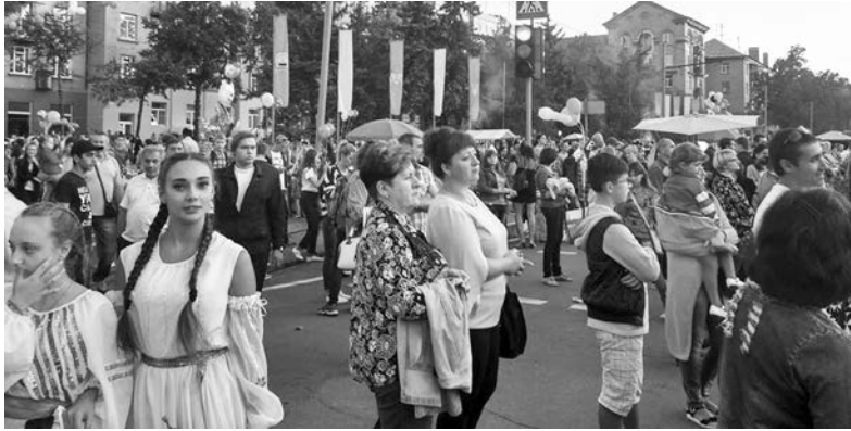
Тысячи зрителей собрались на площади Соборной

В день рождения города в Дружковке зажигали огни, пели вместе со звездами и получали подарки.