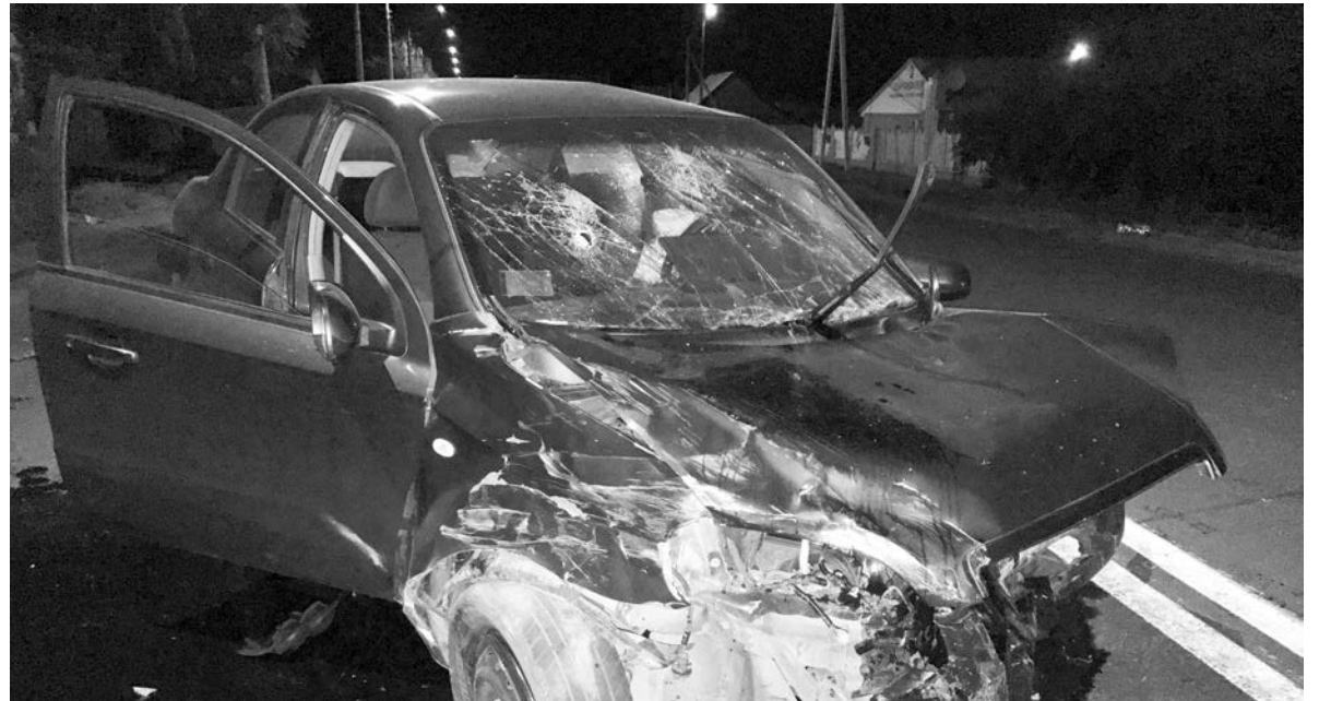
После аварии в Константиновке авто превратилось в груды металлолома

В Константиновке, 10 сентября, около 20:30, на проспекте Ломоносова, между улицами Бульварная и Кирова, случилось жуткое ДТП. По словам очевидцев, водитель Шевроле двигался по проспекту с большой скоростью. Поэтому, когда шофер впереди едущей «десятки» показал знак поворота и притормозил, готовясь выполнить маневр, «гонщик» просто не успел сбавить обороты.