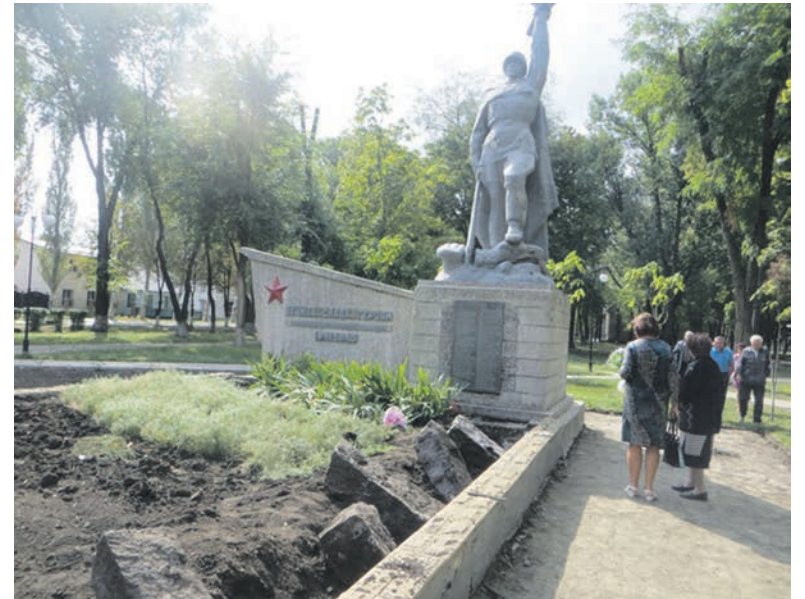
В ходе реконструкции внешний вид памятника не изменится