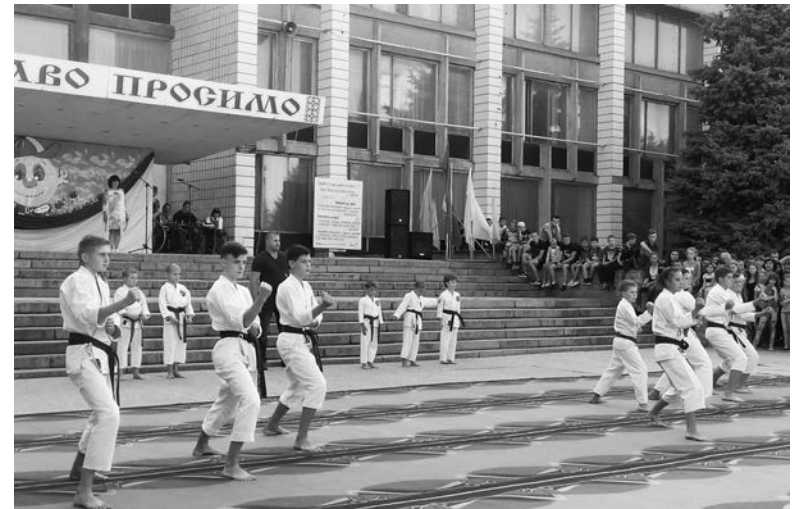
Ко Дню физкультуры и спорта в Константиновке приурочили Олимпийскую неделю и городской праздник

Для жителей и гостей города на празднике выступили ведущие спортсмены и коллективы