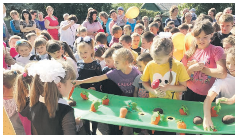
Для детворы были организованы различные конкурсы