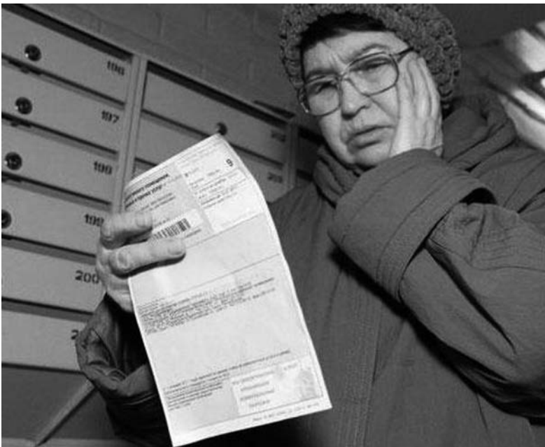
На должников уже поданы иски в суд

Из этих сумм «злостные» долги составляют три миллиона гривен. На должников уже поданы иски в суд на взыскание. Ситуация не в пользу абонентов, так как, кроме самой задолженности, им придется оплачивать 800 гривен судебного сбора и 2% от суммы исполнительской службе.