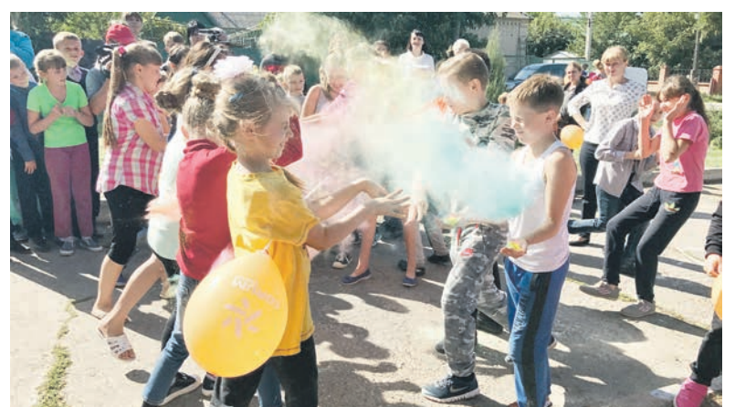
Фестиваль красок холи пришелся по душе школьникам