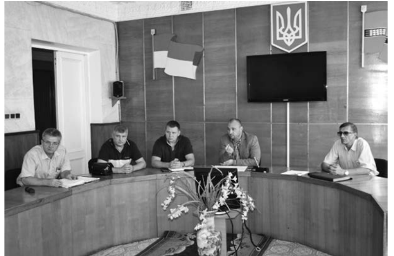
Власти объявили территорию местной свинофермы эпизоотическим очагом