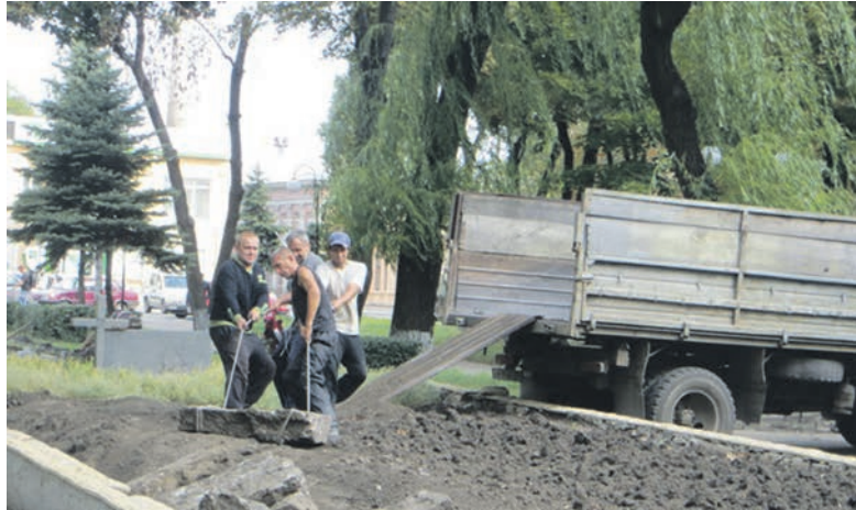
Сейчас демонтируют старые плиты вокруг стелы

Городские власти планируют после ремонта самого памятника облагородить территорию, проложить тротуарные дорожки, установить лавочки и освещение. Появится новая зона отдыха и место для проведения митингов памяти.