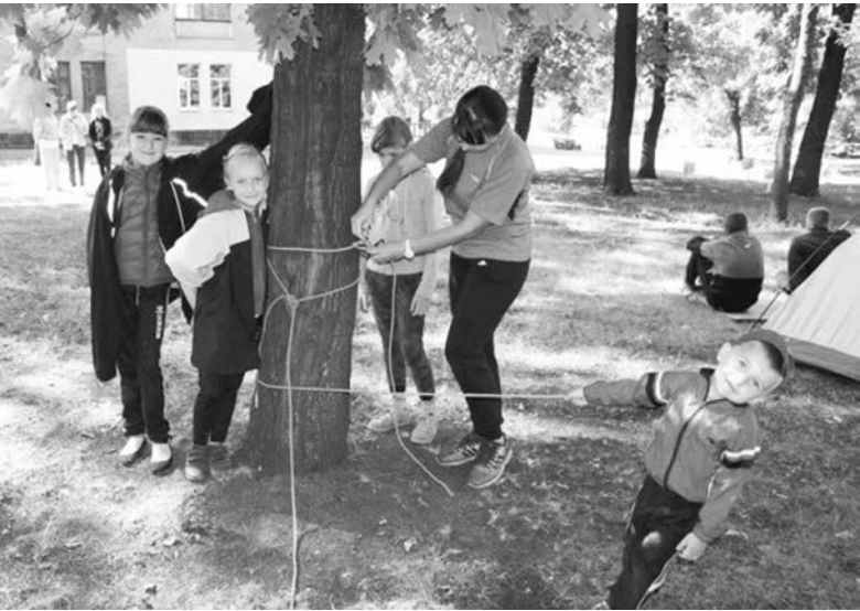
Центр туризма и краеведения презентовал свою работу

Сквер Центра культуры и досуга стал местом проведения необычного мероприятия. Местный Центр туризма и краеведения организовал День открытых дверей.