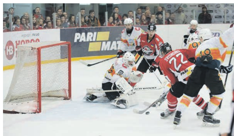
Борьба в матче «Донбасс» – «Кременчук» велась на каждом сантиметре льда

Напряжение достигла апогея, что вылилось в ряд стычек между визави. Успокоили кременчужан лишь два гола в их ворота