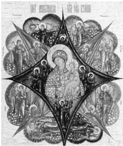
Благочестивое христианское усердие постаралось закрепить в художественном образе эту мысль.

Еще одно толкование прообраза неопалимой купины. Богородица, родившись на грешной земле, пребывала, безусловно, чистой, не причастной к греху, не познавшей беззакония.