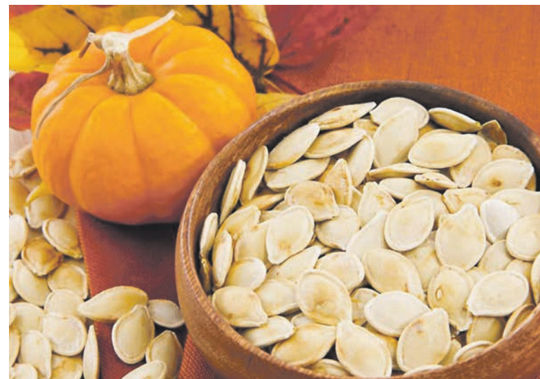
Их лучше употреблять в сыром виде

В дополнение ко всем свойствам тыквенные семечки еще и отлично устраняют стресс: начав их употребление, человек