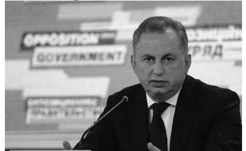
«Не будет энергетики – не будет и экономики», – считает сопредседатель Оппозиционного Блока

– Энергетическая безопасность – это основа безопасности