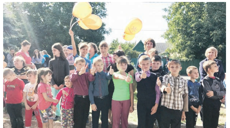
Открытие площадки стало долгожданным событием