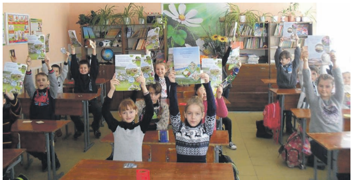
Подарункові сувеніри школярам Донеччини

масової інформації сприяє проведенню екологічного виховної діяльності серед підростаючого покоління. Тому сподіваємося на її продовження і чекаємо того часу, коли природа прокинеться і заграє всіма фарбами своєї краси.