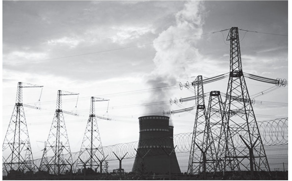
«Блокада» временно не подконтрольных территорий Украины привела к искусственному дефициту антрацитового угля

Правительство Украины очень рассчитывает на национальное сознание инициаторов так называемой «угольной блокады», на их понимание последствий