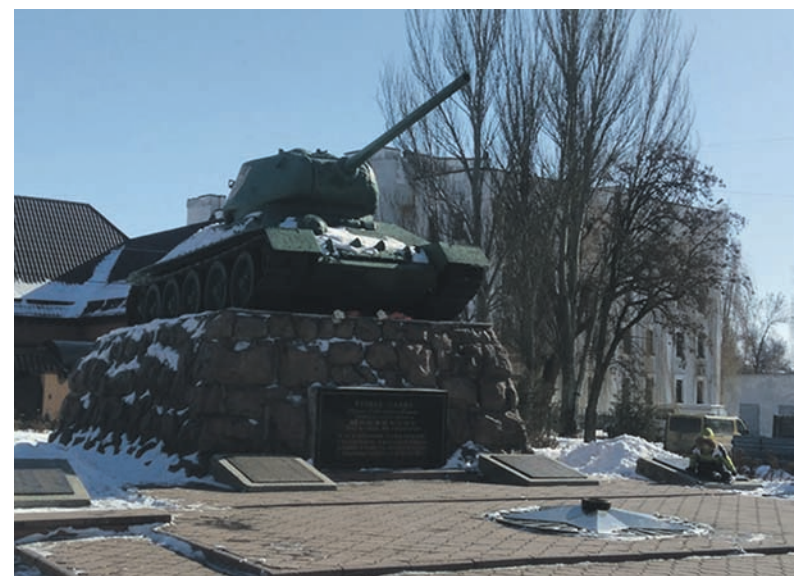
Сейчас возле памятника проходят городские митинги, посвященные памяти воинам-освободителям Донбасса