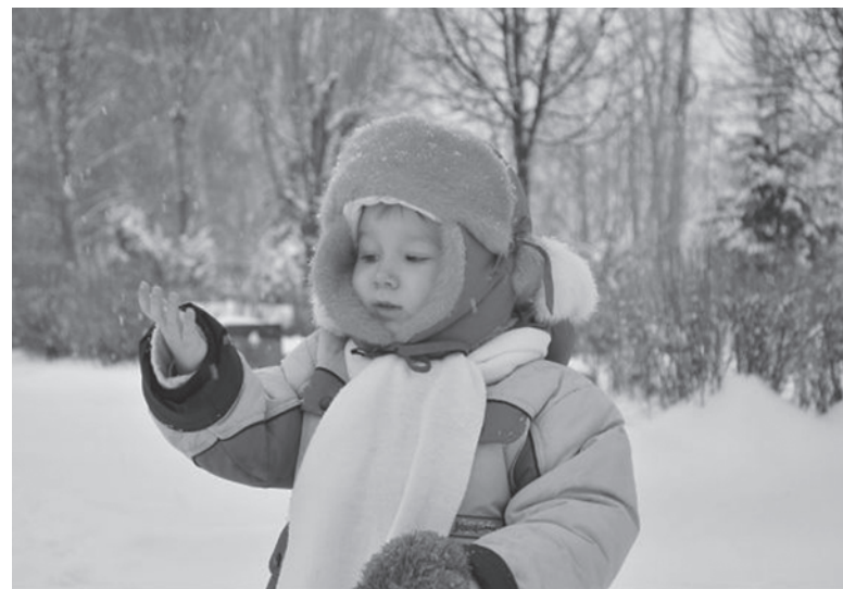
А мальчик так похож на отца