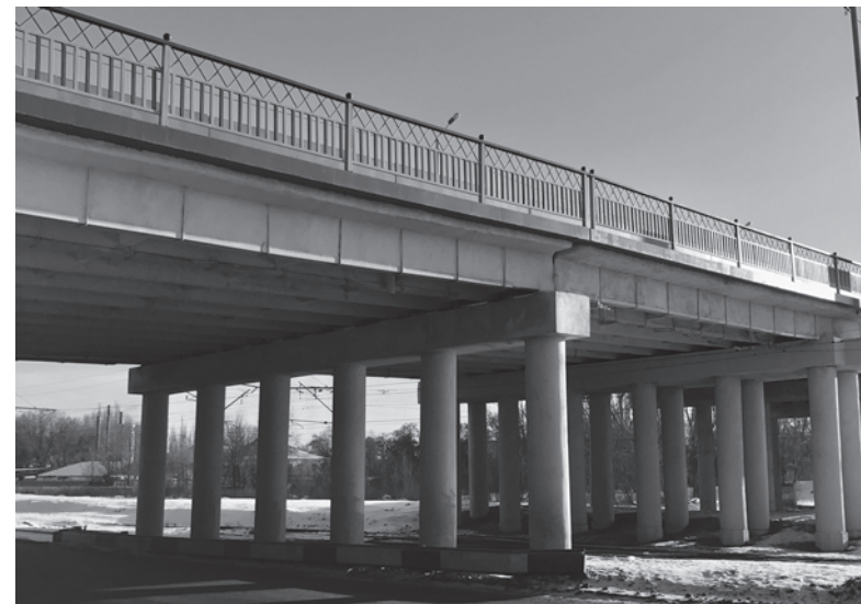
Северный путепровод в Константиновке – один из объектов, который восстановили

Судя по этим цифрам, Донецкая область должна была превратиться в огромную стройплощадку и иметь в конце года сотни отремонтированных дорог, школ, детсадов и больниц. Но