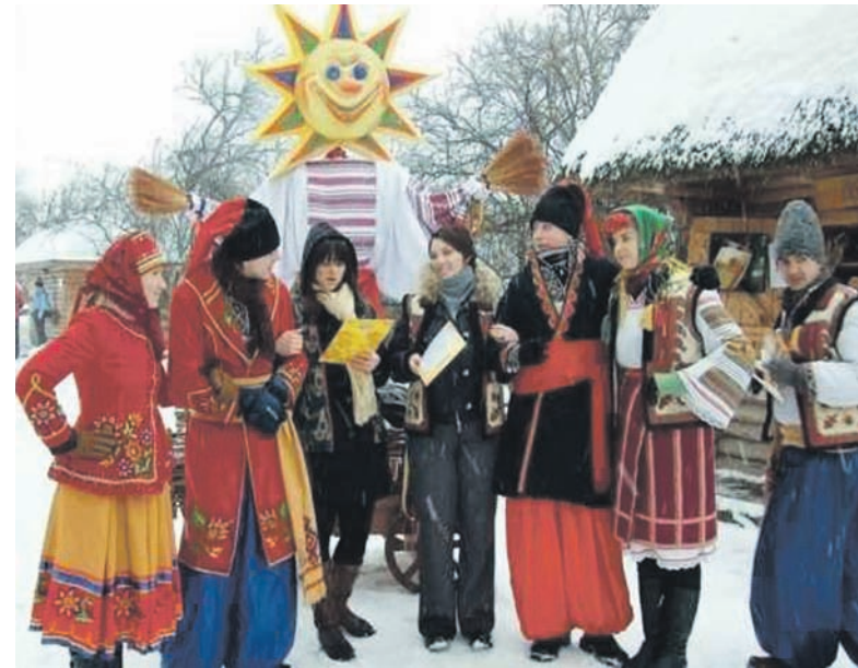
Массовые гулянья длятся всю неделю

Примечателен этот день был широкими гуляньями. Самыми популярными были кулачные бои. В четверг делали чучело