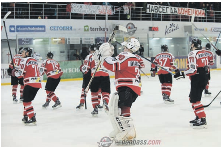
После домашней игры с «Дженералз» хоккеисты «Донбасса» поблагодарили болельщиков за горячую поддержку

На третьей минуте блестящую трехходовку разыграли два новобранца хозяев, легионеры Ка-