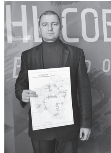
Новый глава с планом Ильиновской объединенной территориальной громады

– Сразу после принятия в Украине законов об административно-территориальной реформе в Константиновском районе всерьез задумались, какой избрать путь: либо полностью согласиться с предлагаемыми сверху рекомендациями, либо разработать собственный план, учитывающий интересы наших жителей. Первоначально предлагалось сформировать единую громаду, в которую полностью вошел бы наш район вместе с Константиновкой. Но по ряду причин не получилось реализовать данную идею. Тогда приступили к реализации другого сценария. Это Ильиновская объ-