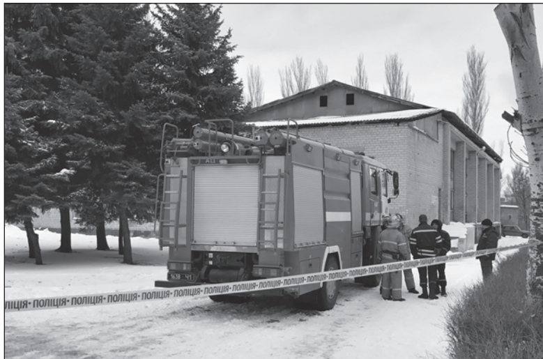
Территорию школы оцепили, детей и учителей эвакуировали

– Дети, педагоги и обслуживающий персонал были эвакуированы в течение 10 минут, – рассказал пресс-офицер Бах-