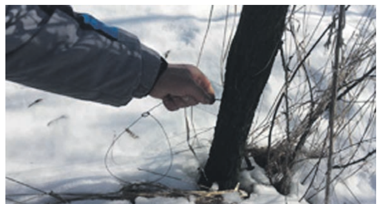
Знімаємо браконьєрські петлі

Адміністрація регіонального ландшафтного парку «Клебан-Бик»