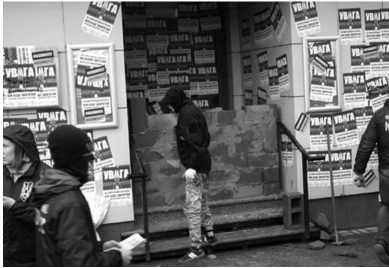
Протестующие в Краматорске от слов перешли к действиям

Вслед за Тернополем отделение «Сбербанка России» замуровали в Краматорске. В понедельник