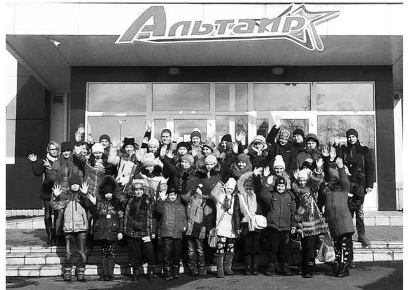
Константиновские школьники на Дружковской Ледовой арене

В наше время быстрого компьютерного и информационного прогресса молодые люди мало стремятся заниматься спортом. Их больше интересует свободное времяпровождение перед экраном монитора. Заставить человека заниматься спортом невозможно, но есть другой способ – заинтересовать, увлечь.