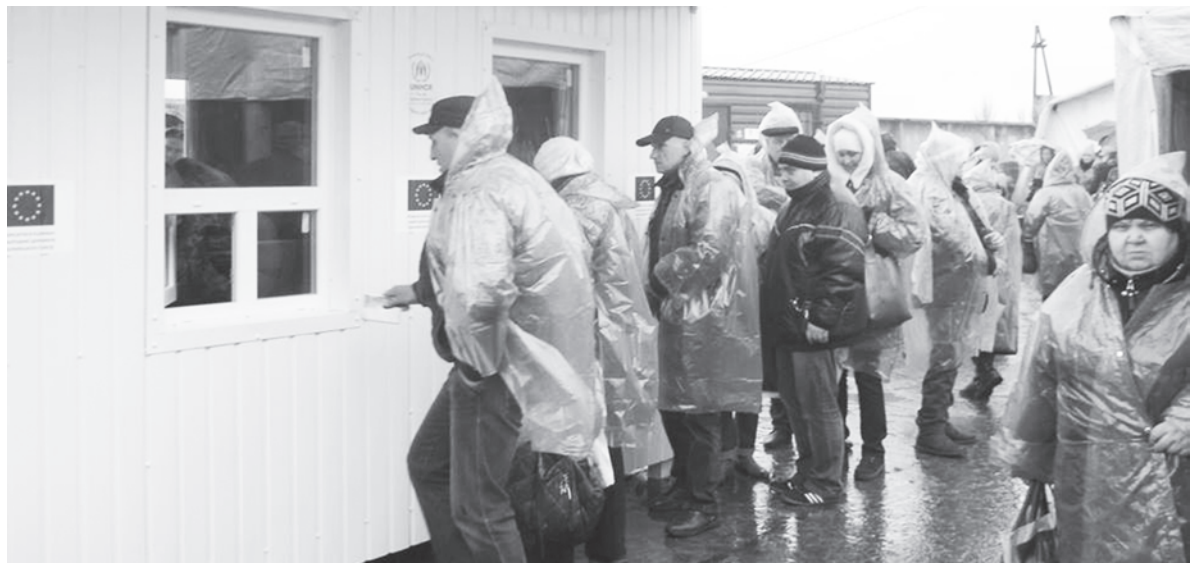
Остаются нерешенными проблемы «нулевого поста» и серой зоны