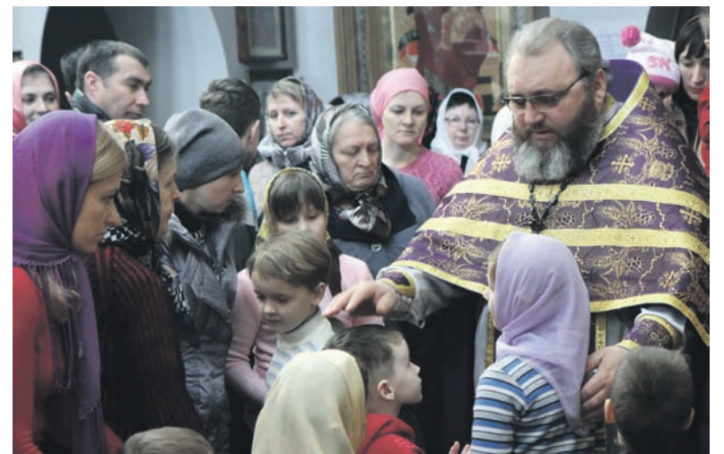
Мы исповедуемся не столько для того, чтобы избежать наказания, сколько, чтобы излечиться духовно