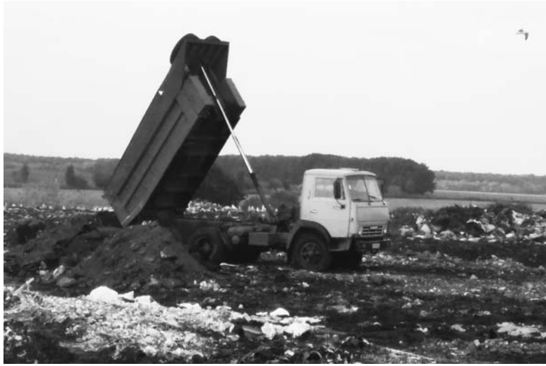
Львовские отходы добрались в Донбасс