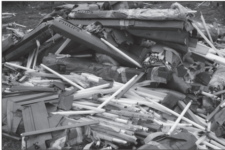
Огромное скопление ламп представляет серьезную угрозу здоровью людей.

По мнению экологов, содержащиеся ртуть лампы могли при-