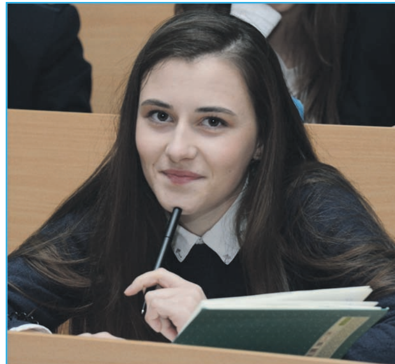
Победители проекта поедут во Францию на авиасалон Ле Бурже

Напомним, студенты технических специальностей со всей Украины борются за поездку от Фонда Бориса Колесникова на Международный авиасалон Ле Бурже во Францию, которая состоится в июне. Организаторы проекта подготовили для ребят насыщенную программу: два дня они проведут на одном из престижных форумов мира, также их ожидают экскурсия по Парижу и посещение Диснейленда.