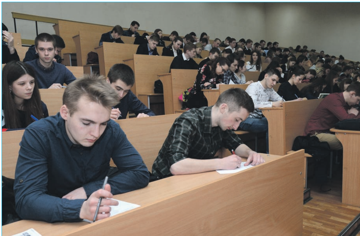
500 юных авиаторов выступили в роли директоров компаний

21 марта состоялся четвертый этап образовательного проекта «Авиатор-2017», который проводится Благотворительным Фондом Бориса Колесникова и является самым масштабным среди студентов технических специальностей.