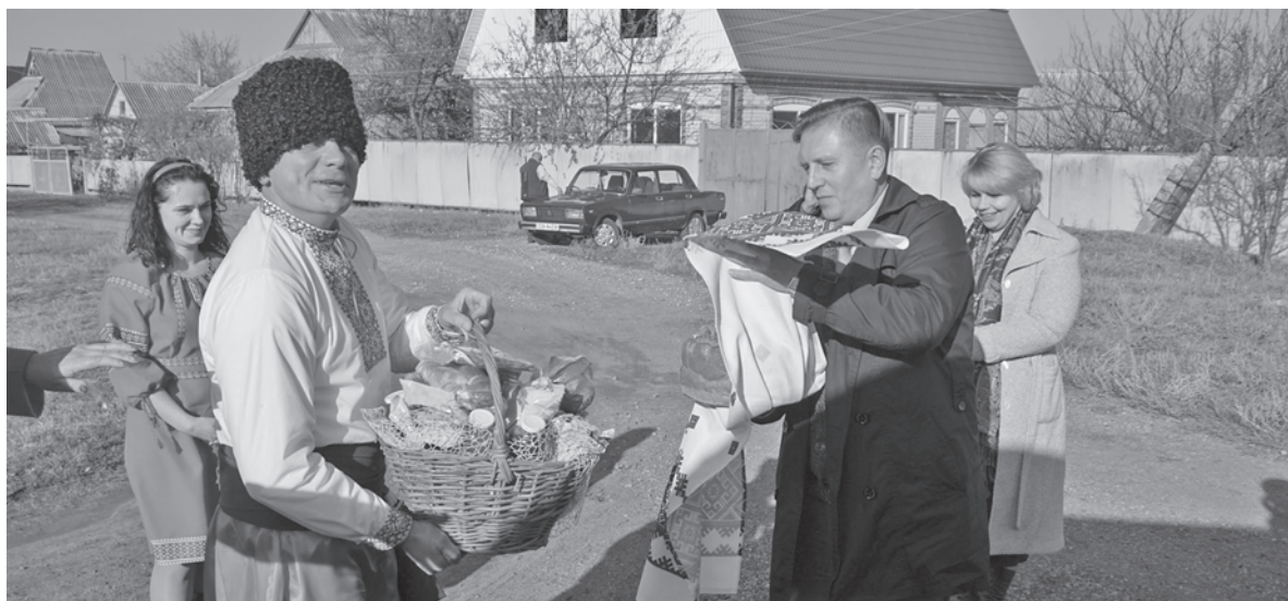
В Александровскую громаду приехали жители за опытом

В следующем году в Киеве состоится Гастрономическая выставка, где будет и экспозиция