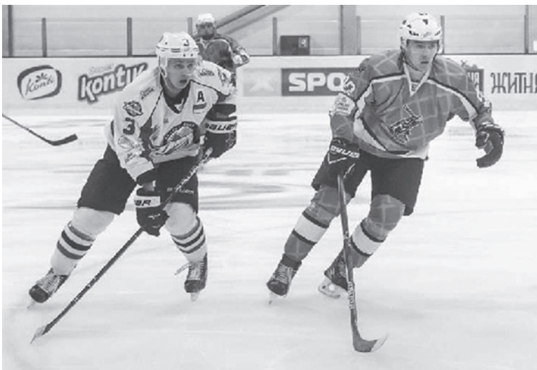
Встреча команд в Херсоне прошла в острой борьбе

Таким образом, учитывая перенесенный матч «Днепра», «горожане» единолично возглавили турнирную таблицу УХЛ и обогнали «Донбасс», который закрепился на третьей строчке, на 12 очков.