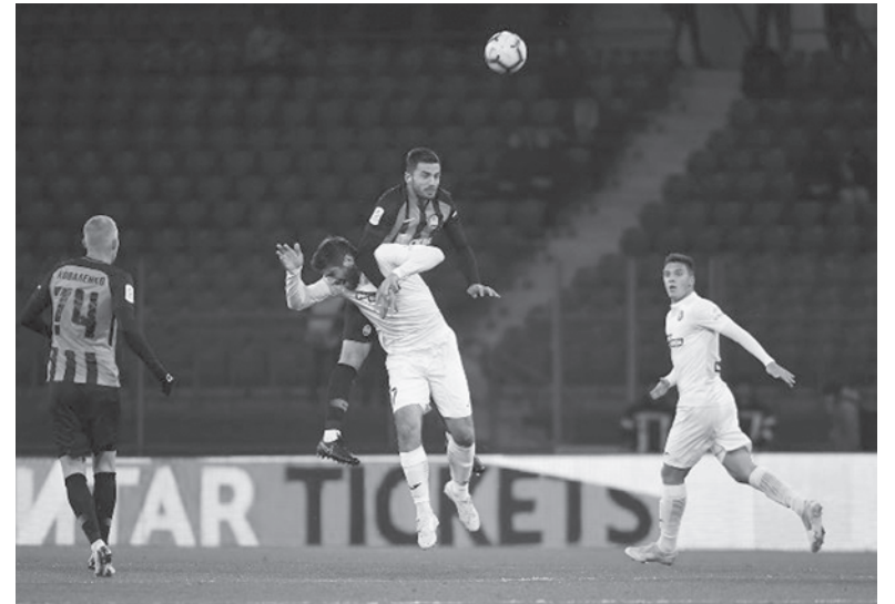
Матч в Харькове получился с непредсказуемым сюжетом