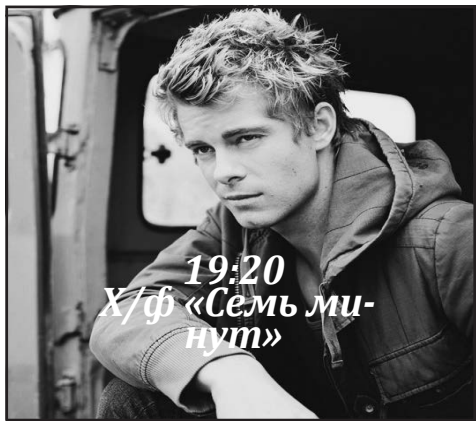
19:20 X/f «Семь минут»

06:00, 07:00, 08:00, 09:00, 12:00, 16:45, 19:30 ТСН: «Телевизионная служба новостей»