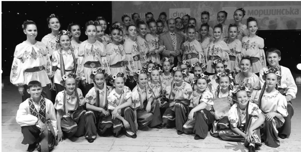
Такого большого успеха представители Константиновки добились на Международном вокально-хореографическом конкурсе «Украина – это ты», состоявшемся в Киеве

Коллективы городского Дворца культуры и досуга – Образцовый эстрадно-хореографический ансамбль «Барбарис» и Образцовый ансамбль танца «Калинка» – за три композиции: «Домовята», «Моя Украина» и «Мы – вместе» – завоевали три первых места, а «Домовята» также отмечены Гран-при. Высокий