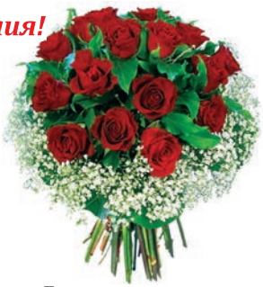
Дети, внуки, правнук

Лучше бабушки и мамы, Знаем, в целом мире нет. Счастья, милая, желаем, Быть здоровой много лет!