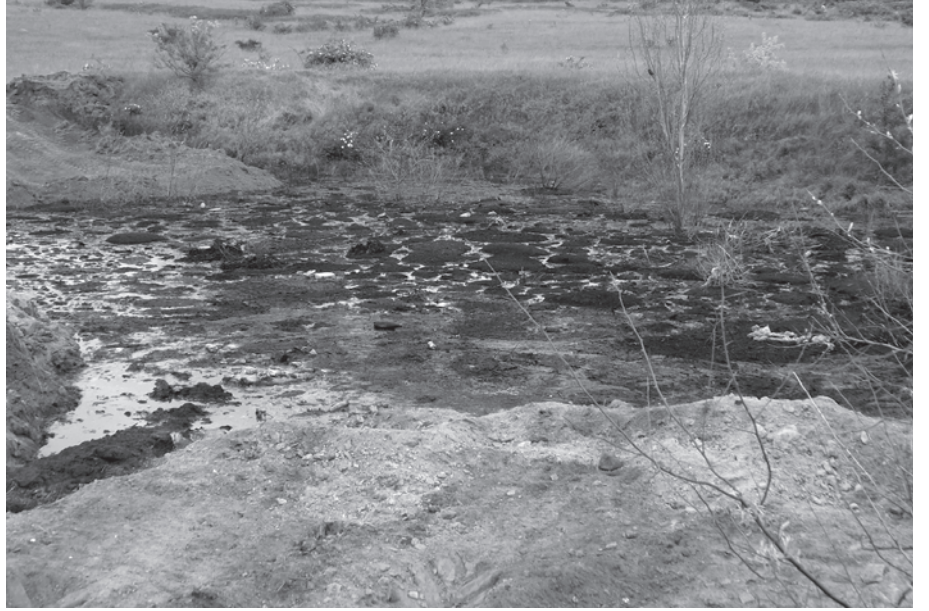
Яма, куди сливали тромбозну кров

Цю думку підтвердив виконуючий обов'язки начальника управління господарського