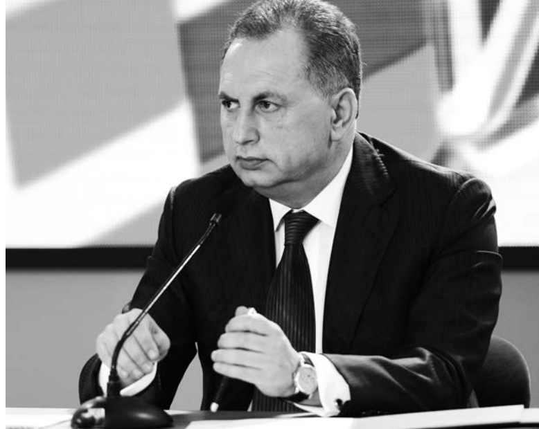
Президент ХК «Донбасс» уверен, что можно сохранить украинский хоккей

– «Донбасс» планирует стартовать 1-го августа, традицион-