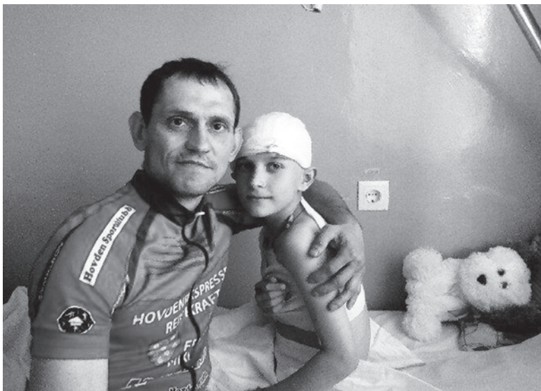
Отец в палате вместе с сыном

Этот факт подтвердила и свидетельница ДТП, которая, со