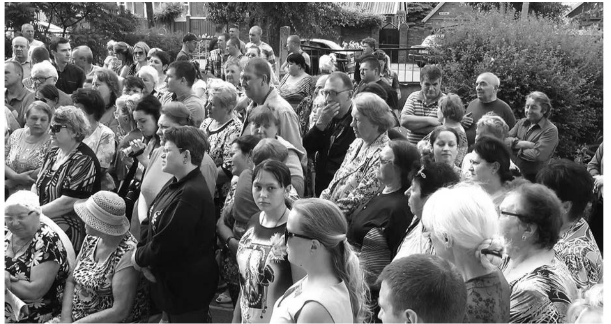
Возле школы №16 собралось больше сотни возмущенных местных жителей