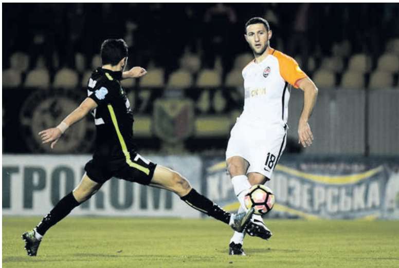
«Александрия» молодежь «Шахтера» не переиграла, но путевку в Лигу Европы смогла завоевать

После встречи в Одессе о своей отставке с поста главного тренера «Динамо» заявил Сергей Ребров (с 2014 года под руководством данного коуча команда дважды становилась чемпионом страны, дважды выигрывала Кубок Украины и один Суперкубок, выходила в 1/8 Лиги чемпионов УЕФА).