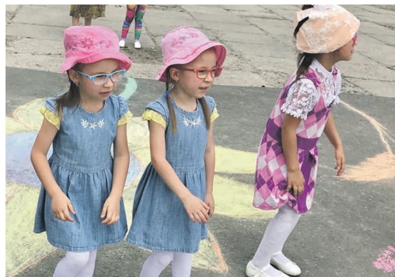
Мальши с удовольствием участвовали в развлечениях

Пожалуй, нет ни одного ребенка, который бы не любил лето. Это время каникул, путешествий, семейного отдыха и веселья. Символично, что и первый день лета во многих странах мира ассоциируется с праздником детства – Международным днем защиты детей.