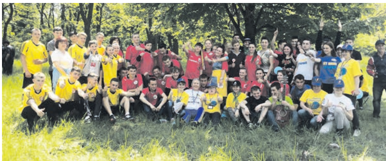
Туризм объединяет молодежь

В Константиновском городском парке культуры и отдыха состоялся ежегодный туристический слет «Мы – патриоты Украины». Организаторами его традиционно стали отдел по делам семьи и молодежи, а также по вопросам физической культуры и спорта Константиновского исполкома горсовета, центр «Спорт для всех» и коммунальное предприятие «Городское социальное общежитие». В турслете участвовало пять команд, по 15 человек каждая, из средних специальных учебных заведений города и района, а именно: медицинский колледж, профессиональный строительный лицей №39, индустриальный техникум, высшее профессиональное училище №113 и Константиновский техникум Луганского национально-