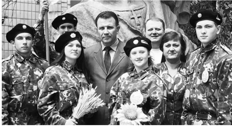
В Дружковке отметили отмену виз для украинцев

Теперь возле исполкома развиваются сразу два флага: Украины и ЕС.