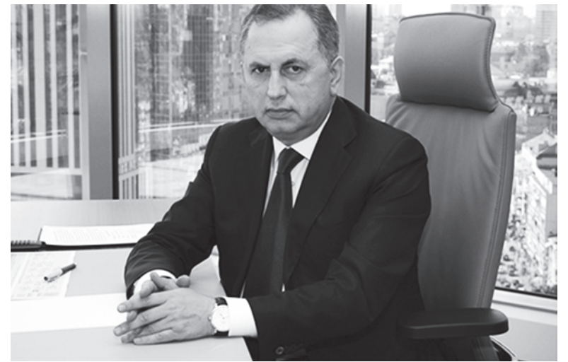
Премьер-министр Оппозиционного правительства Борис КОЛЕСНИКОВ отметил, что Украине надо научиться верить в свои силы

Комментируя результаты президентских выборов во Франции, он отметил, что победа Эммануэля Макрона показывает объединение французского общества в поддержку прагматиков против националистической