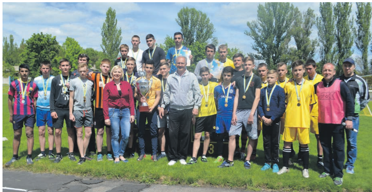
Счастливые лауреаты футбольного турнира