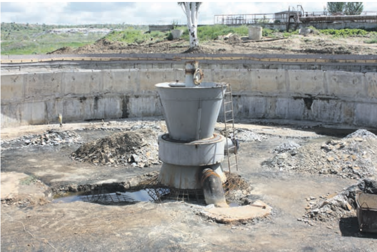
Вторичный радиальный отстойник