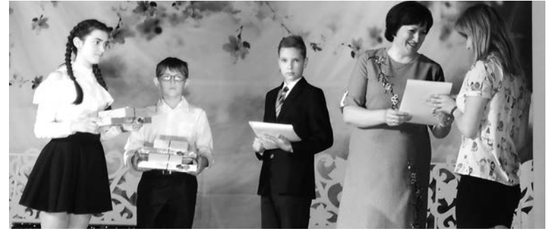
Награждение лучших учащихся

По доброй традиции ежегодно во Дворце культуры шахтоуправления «Покровское» для учащихся УВК№1 проходит «Журавлиный бал», где торжественно поздравляют учеников, которые преуспели в учебе.