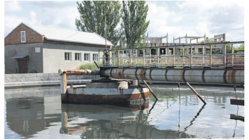
КНС-2 и первичный отстойник после капитального ремонта

Воздуходувная насосная станция подает сжатый воздух на аэротенки, смесители, вакуум-фильтры и другие объекты, потребляющие воздух. Здесь