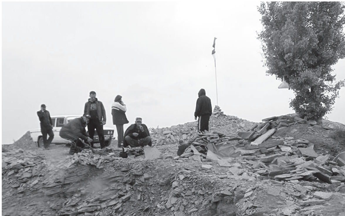
Активисты уже установили пост и каждый день охраняют территорию

Незаконную добычу природного ископаемого остановили ветераны АТО, являющиеся представителями движения «ДІА». Они вызвали полицию, чтобы зафиксировать факт незаконной добычи камня. К слову, правоохранители, знающие о происходящем, не смогли в полной мере предотвратить рас-