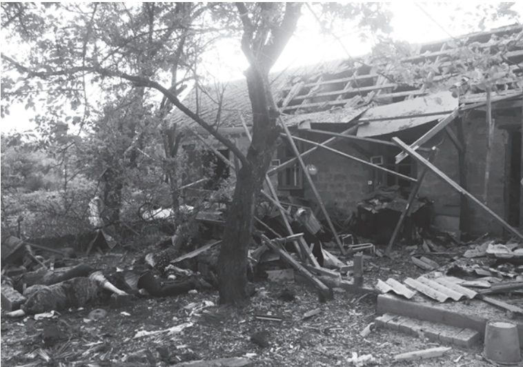
Снаряд прилетел в частный дом по улице Сапронова

В субботу вечером прифронтовая Авдеевка снова подверглась обстрелу. Осколки унесли жизни четырех людей, еще один в тяжелом состоянии был госпитализирован. Об этом сообщает Покровский отдел полиции.