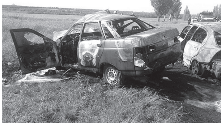
Выжить после ДТП не удалось никому

на встречную полосу. Водитель «десятки» попытался уйти от столкновения, съехал на обочину, но было уже поздно. От удара оба авто вспыхнули, как два факела. Спасатели сообщили, что один из водителей и женщина-пассажир погибли на месте. Второму самостоятельно удалось выбраться из машины, но мужчина скончался до прибытия скорой помощи. Воспламенение спровоцировало газовое оборудование в одной из машин.