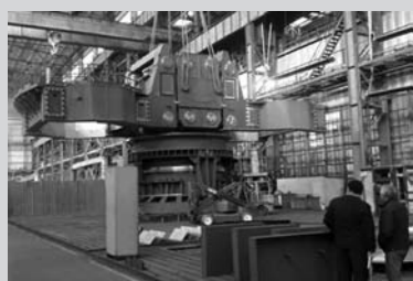
Кран для «Азовстали»

Новокраматорский машиностроительный завод приступил к изготовлению двух мощных литейных мостовых кранов для меткомбината «Азовсталь» (г. Мариуполь). Контракт с финансовой группой «Метинвест» на изготовление уникального оборудования заключен в сентябре минувшего года.