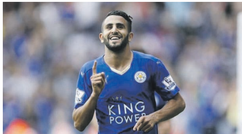
Марез радуется своей игрой и англичан, и африканцев

Полузащитник английского «Лестера» Рияд Марез признан лучшим футболистом Африки 2016 года. В прошлом сезоне 25-летний алжирец стал чемпионом Англии в составе «Сити», забив 17 мячей в 37-ми матчах АПЛ. По итогам го-