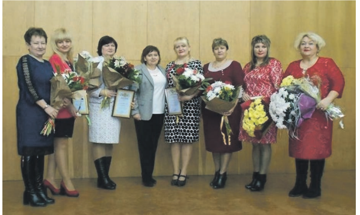
Лучшие учителя года из Доброполья

О каждом из конкурсантов был показан небольшой видеофильм, но главное решение о победи-