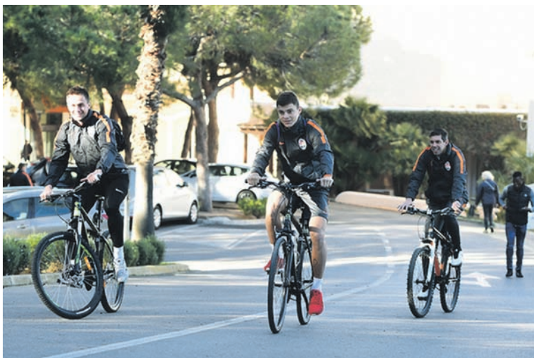
Перед тренировкой – разминка на велосипедах

После обмена поздравлениями и впечатлениями от отпуска, обеда и небольшого отдыха