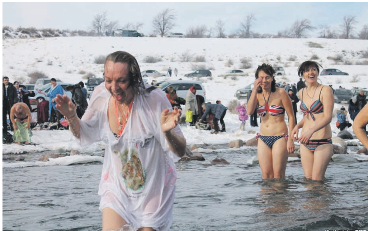
В числе людей, готовых 19 января окунуться в прорубь, каждый год все больше молодежи

Играла музыка, праздничные песни исполнял ансамбль «Любава». Батюшка провел обряд освящения воды, и я как бы прониклась атмосферой праздника. Глядя на купающихся людей, решила. Переоделась, обула шлепанцы и спокойно вошла в прорубь вместе с несколькими женщинами. Три раза перекрестилась и прочла «Отче наш». Холода не чувствовала совсем, три раза окунулась в воду и вышла назад. Мне подали халат, и я еще несколько минут рассказывала о своих ощущениях корреспонденту местного телевидения. В