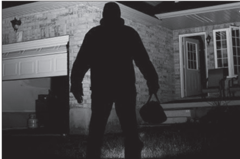
В уголовном мире существуют свои секреты воровского «ремесла»

Почти во всех случаях потерявшие сами привлекают преступников, рассказывая то, о чем следует хранить молчание. Собирая деньги на определенные покупки, например, машину, вы нечаянно обронили об этом среди близкого окружения. В свою очередь, эти люди могут повесть вашу тайну своим друзьям, порядочность которых никто не