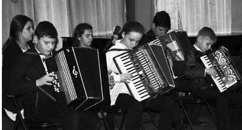
На приобретение новых музыкальных инструментов израсходовано 490 тысяч гривен